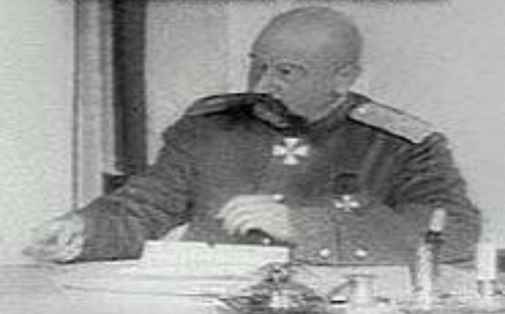
Юденич Николай Николаевич