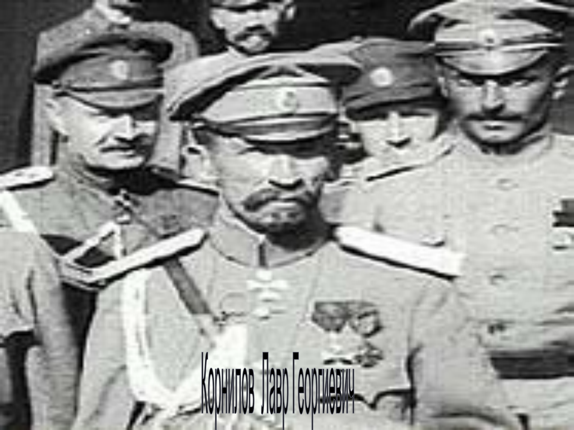
Корнилов Лавр Георгиевич