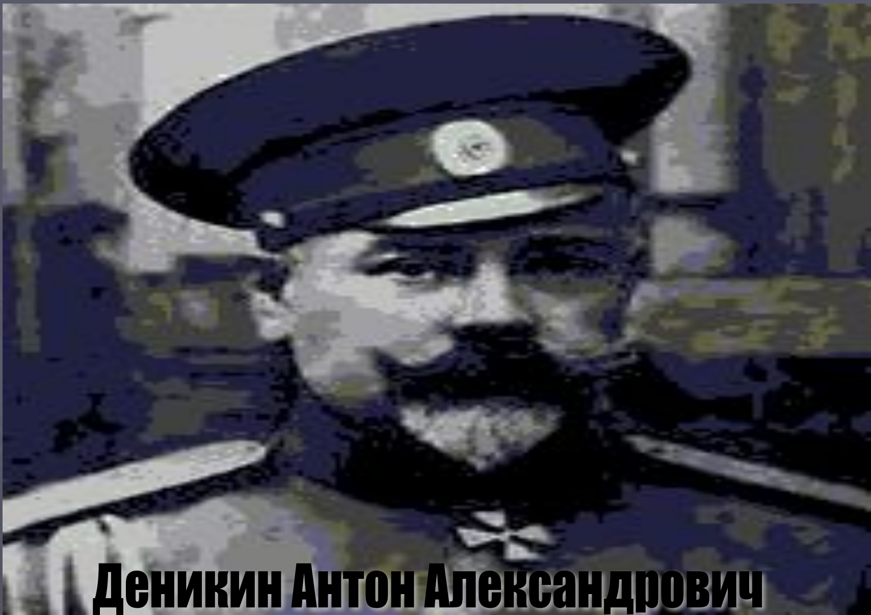
Деникин Антон Александрович