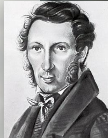
Сергей Петрович Трубецкой