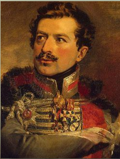
Михаил Андреевич Милорадович

□ Николай I с помощью духовенства (Митрополит Серафим) и популярного в войсках военачальника героя отечественной войны М.А. Милорадовича предпринял попытку ликвидировать восстание мирным путем, но петербургский генерал-губернатор Милорадович был застрелен Каховским.