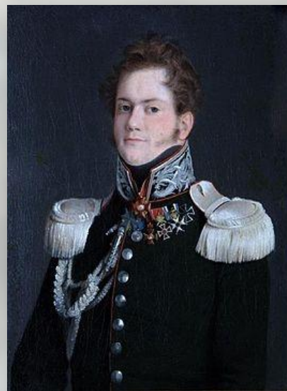
Александр Николаевич Муравьев (1806-1874)