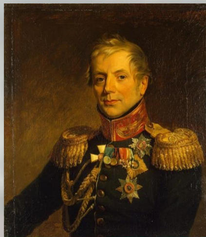
Михаил Бестужев- Рюмин (1803-1826)