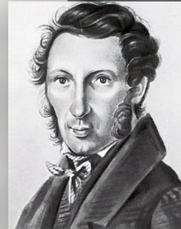
Сергей Петрович Трубецкой