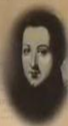
МИХАИЛ БЕСТУЖЕВ- РЮМИН