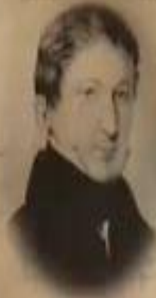
МАТВЕЙ МУРАВЬЁВ- АПОСТОЛ

№ Имя Фамилия Секретное название 3 Матвей Муравьев-Апостол Южное общество