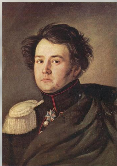
Сергей Иванович Муравьев-Апостол (1796-1826)

Другие настаивали на умеренных преобразованиях страны. В итоге разные стороны пошли своим путем.