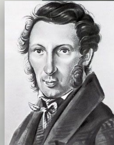
Сергей Петрович Трубецкой