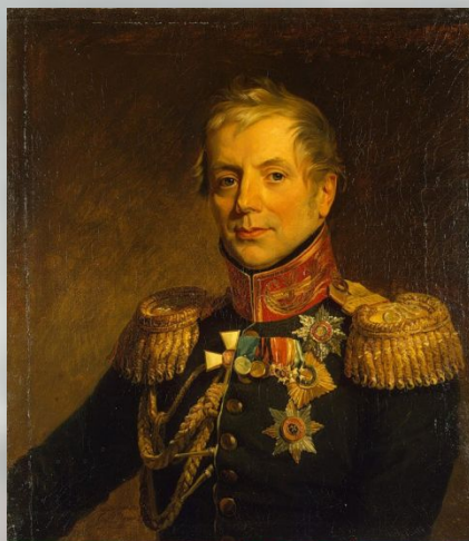
Михаил Бестужев- Рюмин (1803-1826)