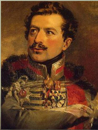
Михаил Андреевич Милорадович

□ Николай I с помощью духовенства (Митрополит Серафим) и популярного в войсках военачальника героя отечественной войны М.А. Милорадовича предпринял попытку ликвидировать восстание мирным путем, но петербургский генерал-губернатор Милорадович был застрелен Каховским.