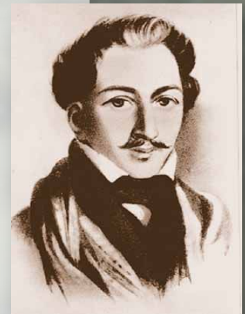
Каховский Петр Григорьевич