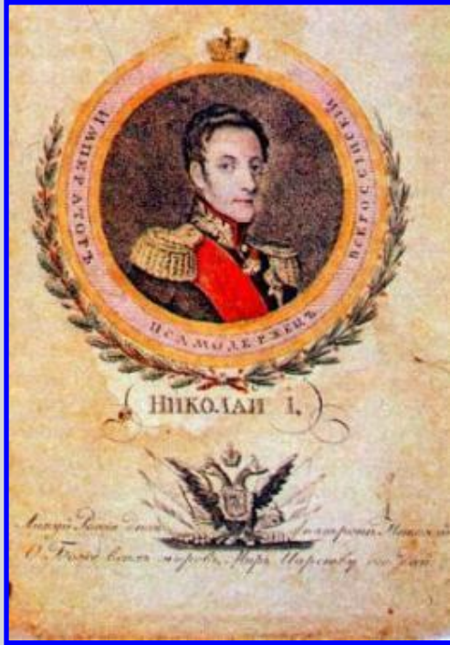
Листовка выпущенная к коронации Николая I

Переприсяга Сената, Синода и госсювета прошла ночью. Рано утром 14 декабря декабристы отправились по своим полкам, но удалось вывести на Сенатскую площадь лишь часть Московского полка под командованием А.А. Бестужева, Гвардейский флотский экипаж и шесть рот Лейб-гренадерского полка (всего около 3000 тыс.чел.). Солдаты не знали зачем их привели на площадь. Диктатор восстания – С.Трубецкой, на площадь не явился, П.Г.Каховский отказался убивать царя, А.И.Якубович отказался штурмовать Зимний дворец.