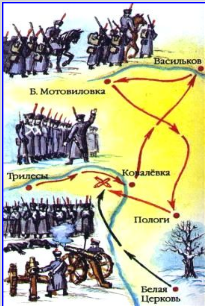
Восстание Черниговского полка

Южное общество должно было выступить, получив известие о победе в столице.