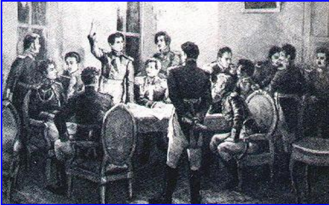
Г.Ивановский Московский Заговор 1817 г.

В рамках Союза Д.Якушкин и М.Лунин впервые выдвинули предложение о необходимости царубийства в результате заговора. Съезд Союза в 1821 г. принял решение самораспуститься и перейти к созданию тайных обществ.