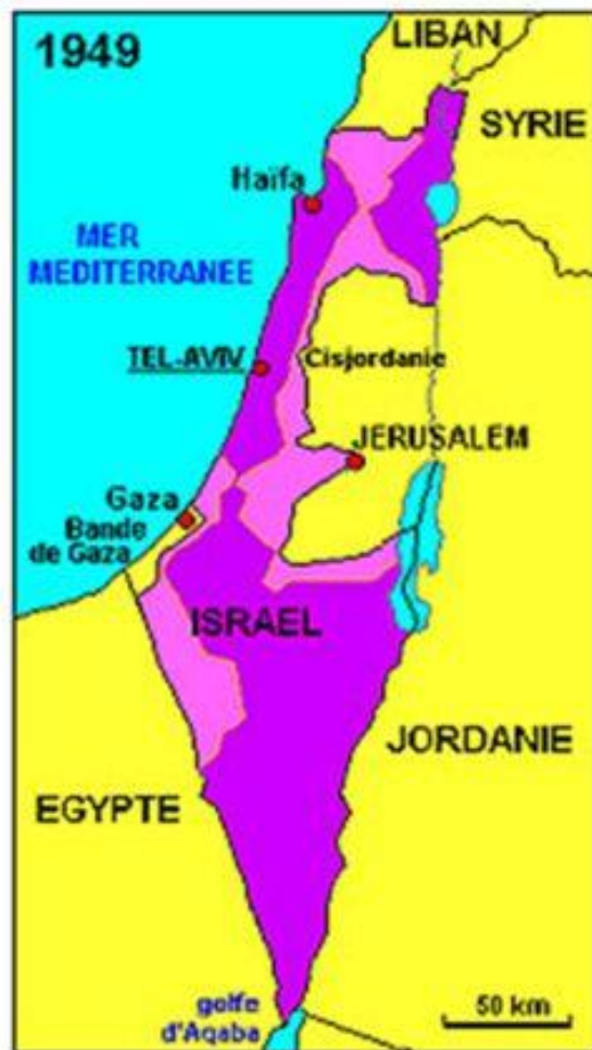
APRES LA GUERRE DE 1948-1949

Palestine britannique Etat arabe (palestinien) Etat juif zone internationale