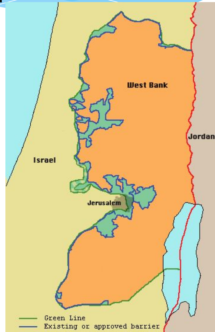
West Bank barrier - May 2005