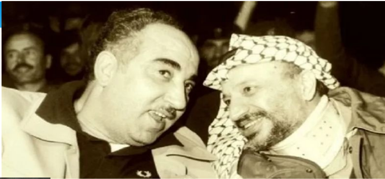
Салах Халаф и Ясир Арафат