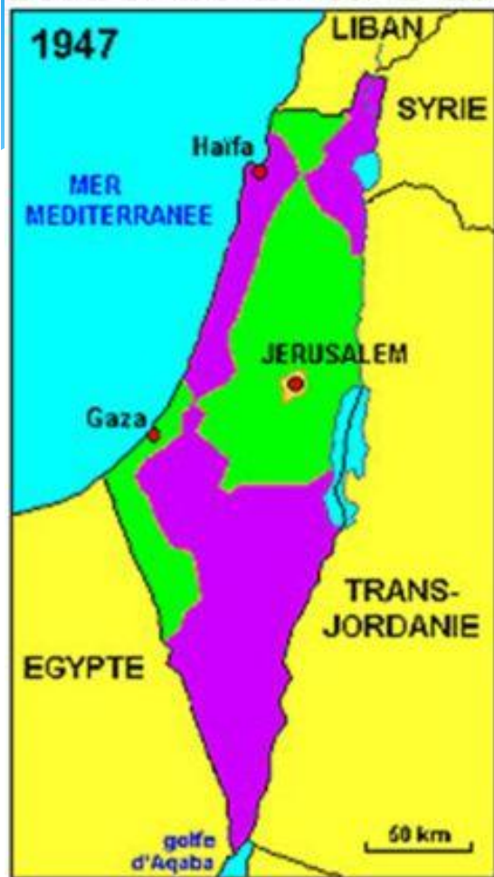
LE PLAN DE L'O.N.U.