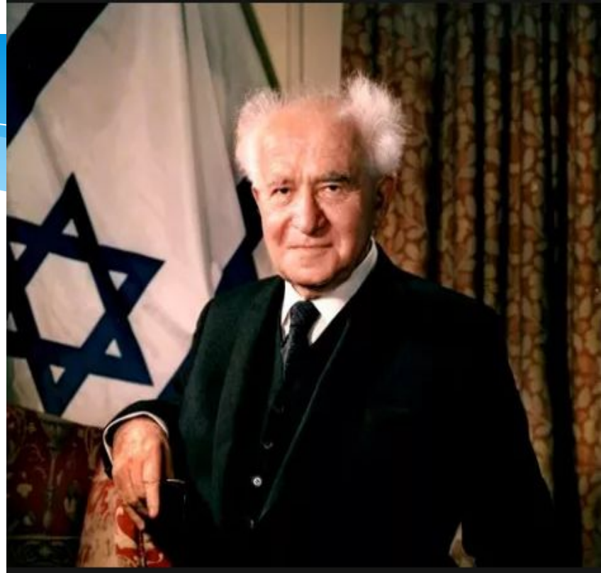
Давид Бен-Гурион (1886-1973)

* 15 мая 1948 Лига арабских государств объявила Израилю войну и пять арабских государств (Египет, Сирия, Иордан, Ирак, Алжир) напали на Израиль.