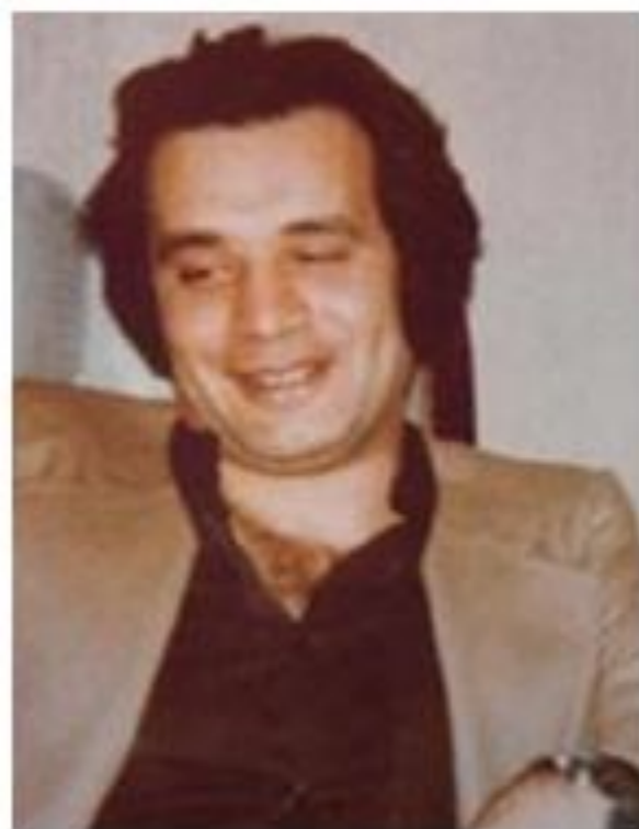
Лидер - Али Хасан Саламех («Красный принц»)