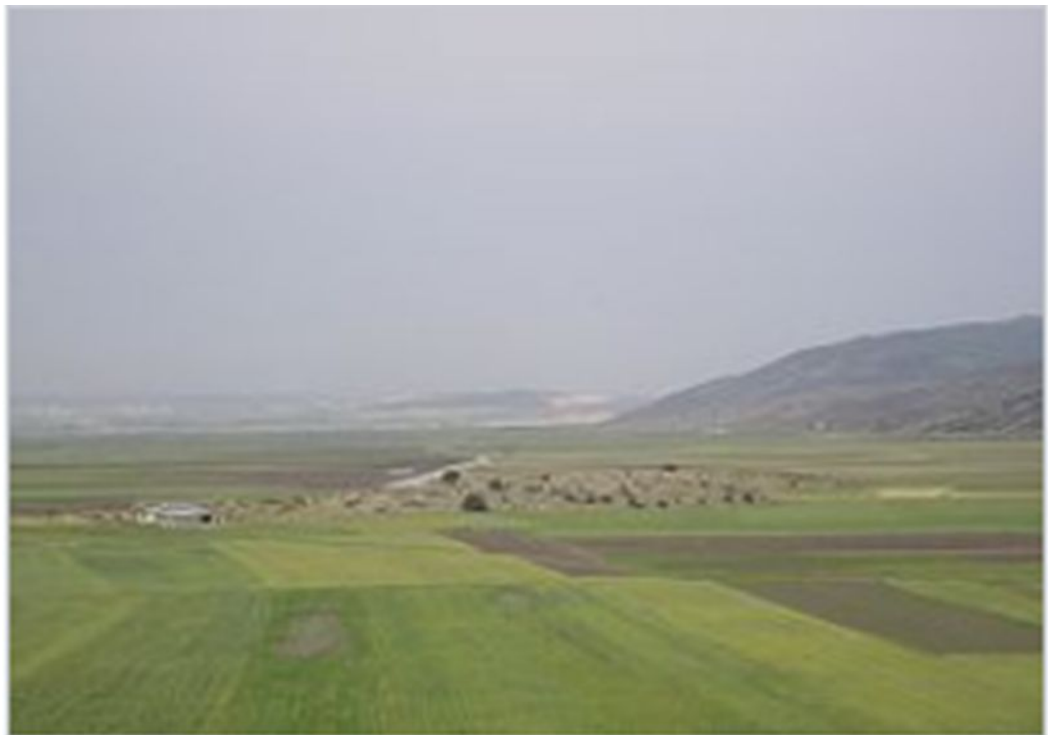
Участок всеизраильского водопровода в долине Бейт-Нетофа