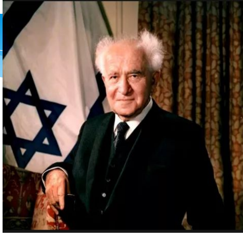
Давид Бен-Гурион (1886-1973)

* 15 мая 1948 Лига арабских государств объявила Израилю войну и пять арабских государств (Египет, Сирия, Иордан, Ирак, Алжир) напали на Израиль.