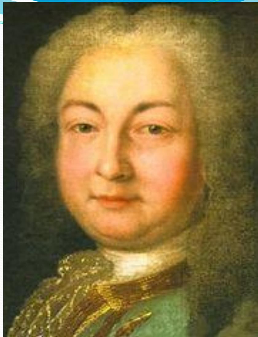
А. И. Остерман.

А. И. Остерман, сделавшись воспитателем и наставником юного царя, старался выполнять свою работу самым добросовестным образом. Однако, несмотря на все свои старания, Остерман так и не сумел оказать должного влияния на мальчика-самодержца.