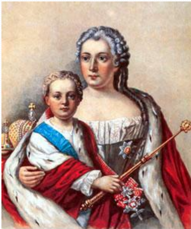
Иоанн VI Антонович (1740-1764)

Незадолго до смерти Анна Ивановна объявила наследником престола Ивана Антоновича, сына своей племянницы Анны Леопольдовны, а регентом со всей полнотой власти - Бирона. Однако Бирон недолго оставался у власти. Прошло менее месяца после смерти Анны Иоанновны. Гвардия свергла ненавистного правителя. Регентшей объявляется Анна Леопольдовна, однако у власти оставаться ей суждено было не более года.