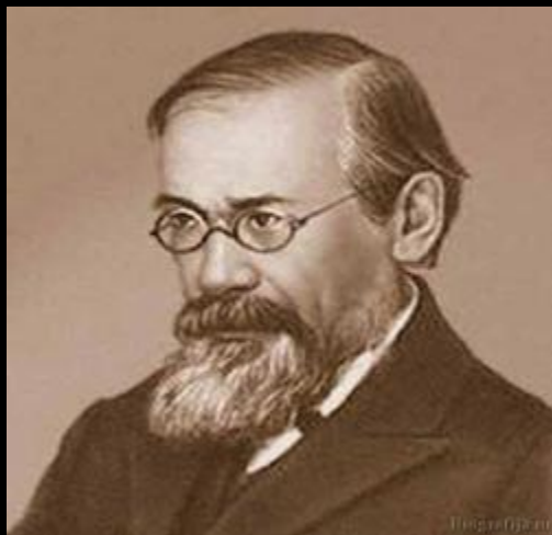
Историк Ключевский В.О