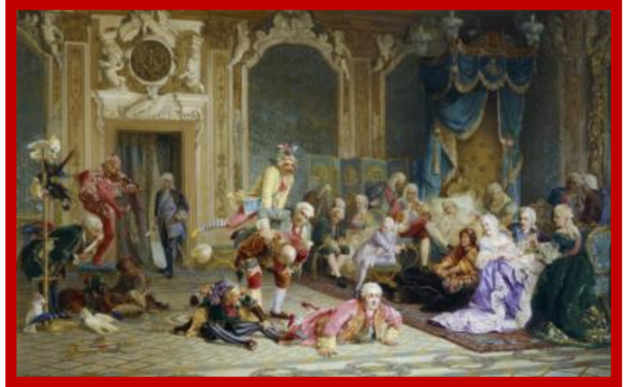
Якоби Валерий Иванович. Шуты при дворе императрицы Анны Иоанновны.

1730-1740 гг. - правление Анны Иоанновны Племянница Петра I, вышедшая замуж за герцога Курляндского, прозвище «Кровавая», «Митавская затворница».