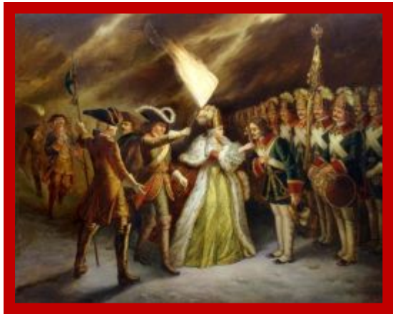
Присяга преображенцев дочери Петра Великого.