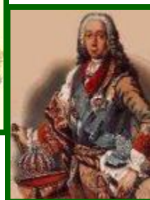
Петр III 1761-1762