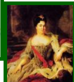
Екатери на I 1725-1727