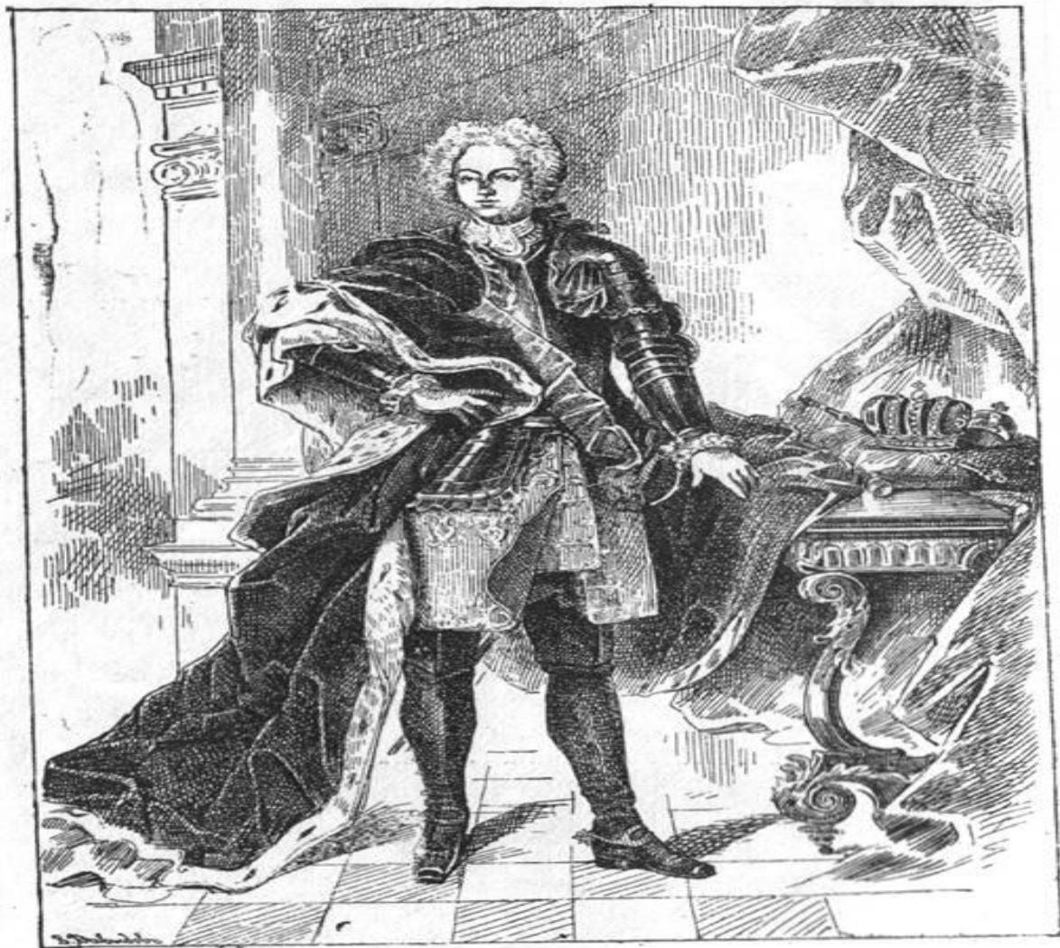
Императоръ Петръ II.

Въ самый день коронаціи не было обнародовано никакихъ милостей, но, по случаю ея, ранѣе, 27 апрѣля, и позже—18 мая изданы были указы, которыми давалась отсрочка въ уплатѣ недоимки денежныхъ сборовъ, провіанта, фуража и казенныхъ долговъ.