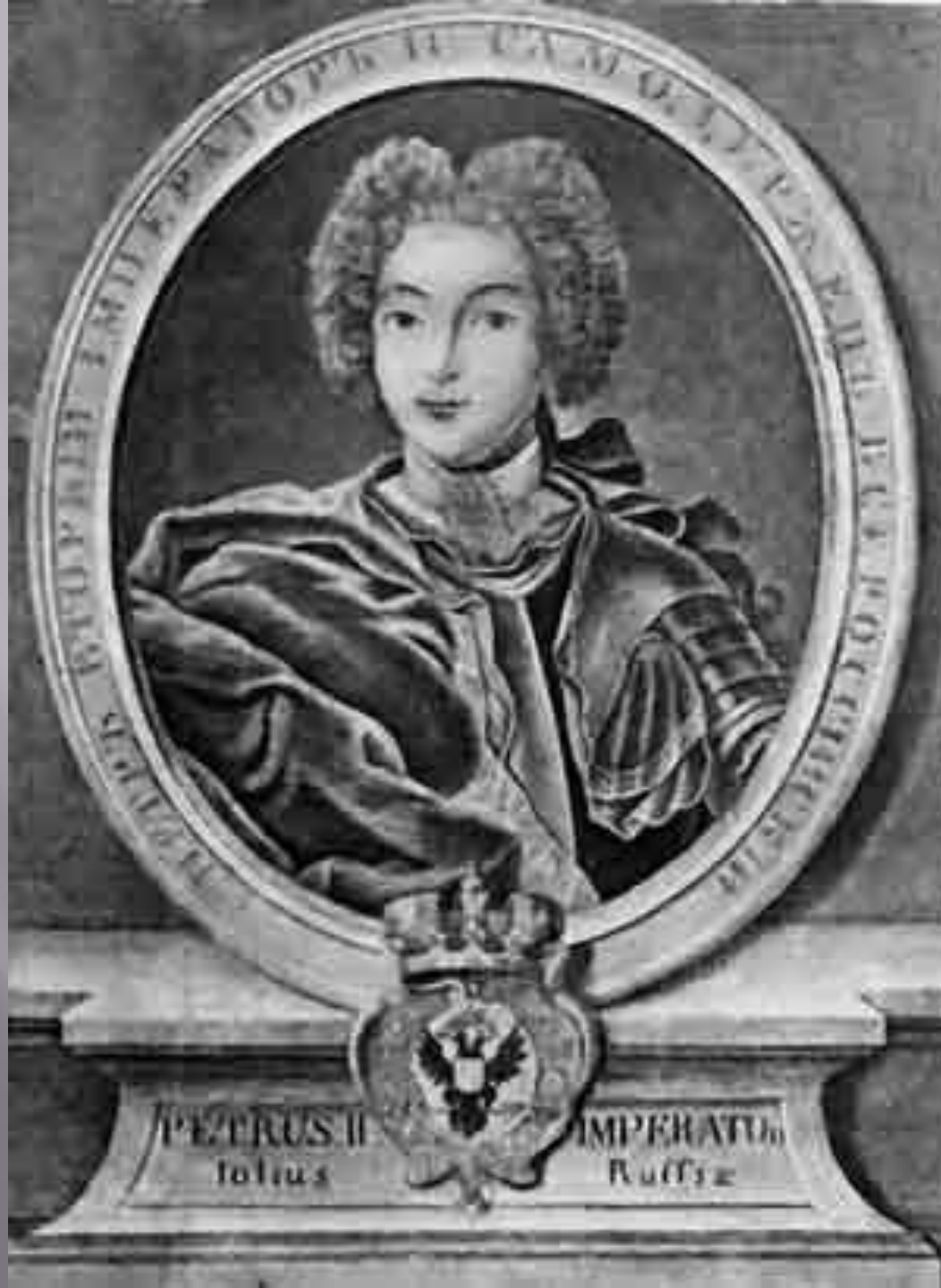
Петр II (1725-1727) при нем упрочились Долгорукие