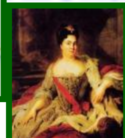
Екатерина I 1725-1727