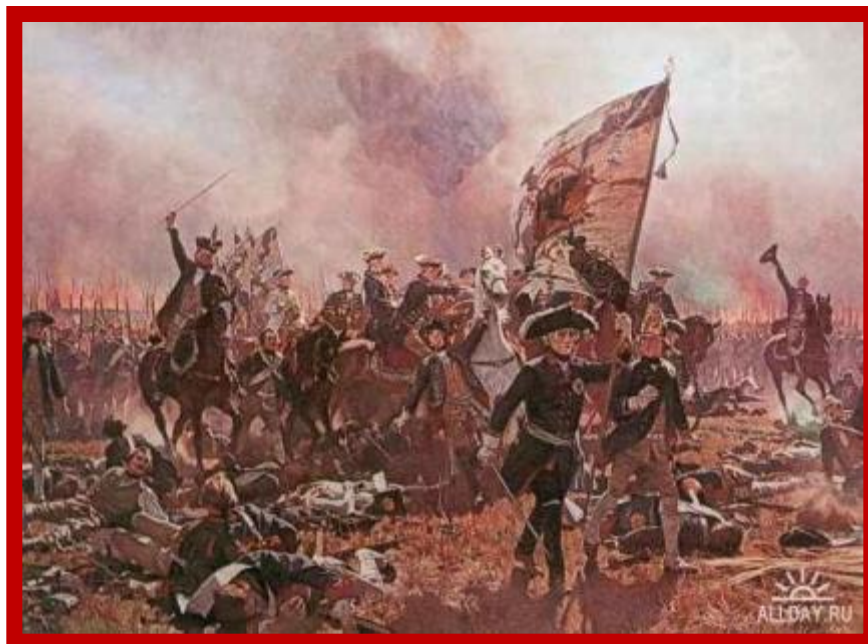
Сражение у Цорндорфа

1761 г. – смерть Елизаветы Петровны. Петр III заключил с Фридрихом II союз против своих бывших союзников и вернул Пруссии все завоевания.