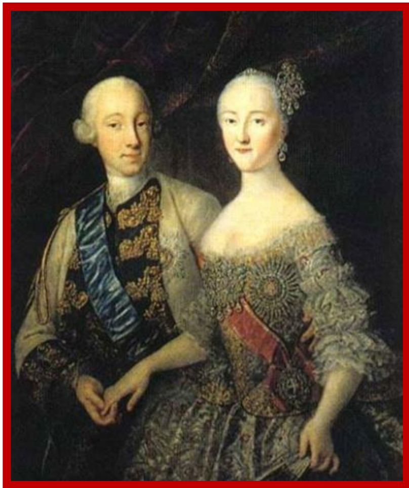
Петр Федорович, великий князь, Екатерина Алексеевна, великая княгиня.