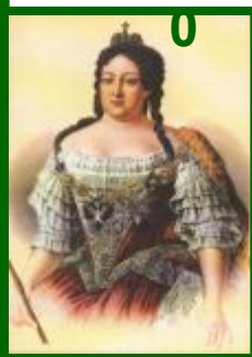
Анна Иоанновна 1730-1740