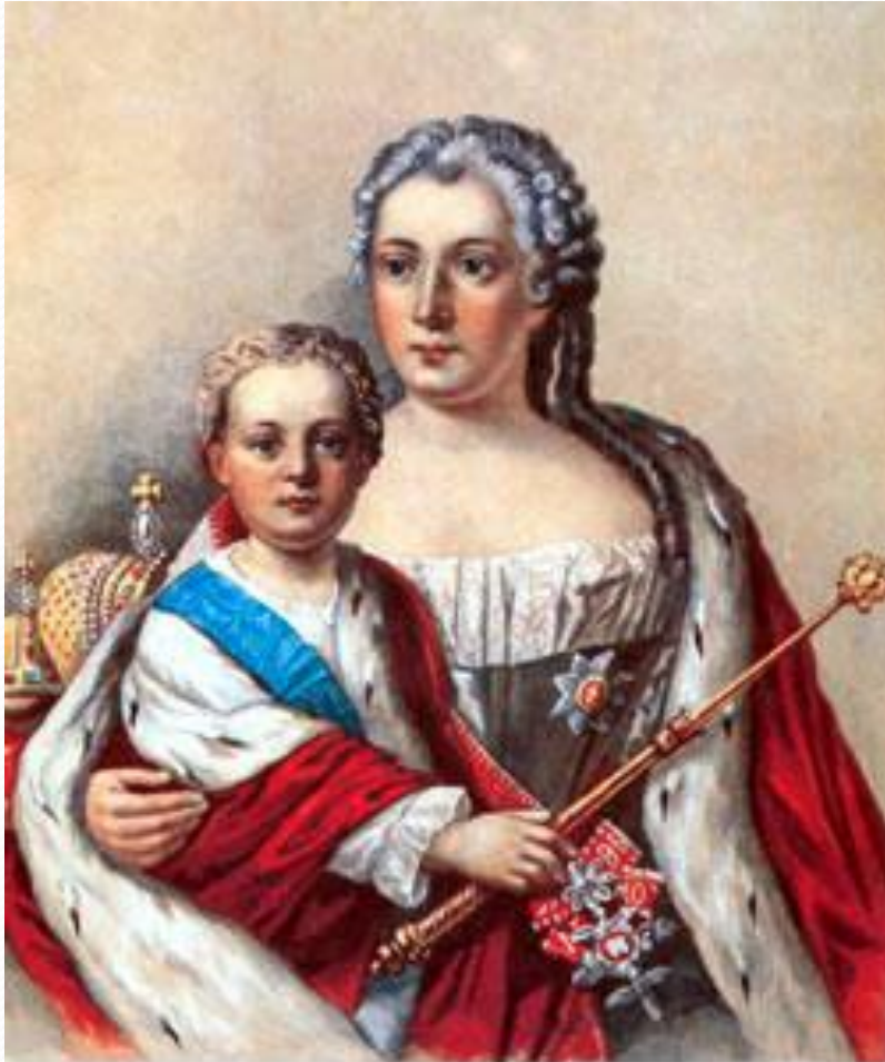
Иоанн VI Антонович (1740-1764)

Незадолго до смерти Анна Ивановна объявила наследником престола Ивана Антоновича, сына своей племянницы Анны Леопольдовны, а регентом со всей полнотой власти - Бирона. Однако Бирон недолго оставался у власти. Прошло менее месяца после смерти Анны Иоанновны. Гвардия свергла ненавистного правителя. Регентшей объявляется Анна Леопольдовна, однако у власти оставаться ей суждено было не более года.