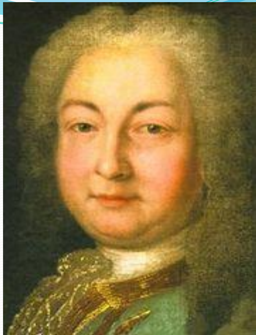
А. И. Остерман.

А. И. Остерман, сделавшись воспитателем и наставником юного царя, старался выполнять свою работу самым добросовестным образом. Однако, несмотря на все свои старания, Остерман так и не сумел оказать должного влияния на мальчика-самодержца.