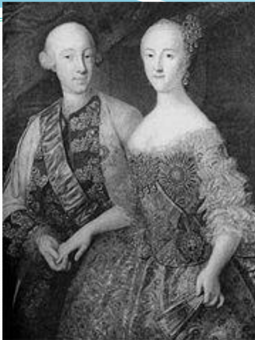
Пётр и Екатерина: совместный портрет