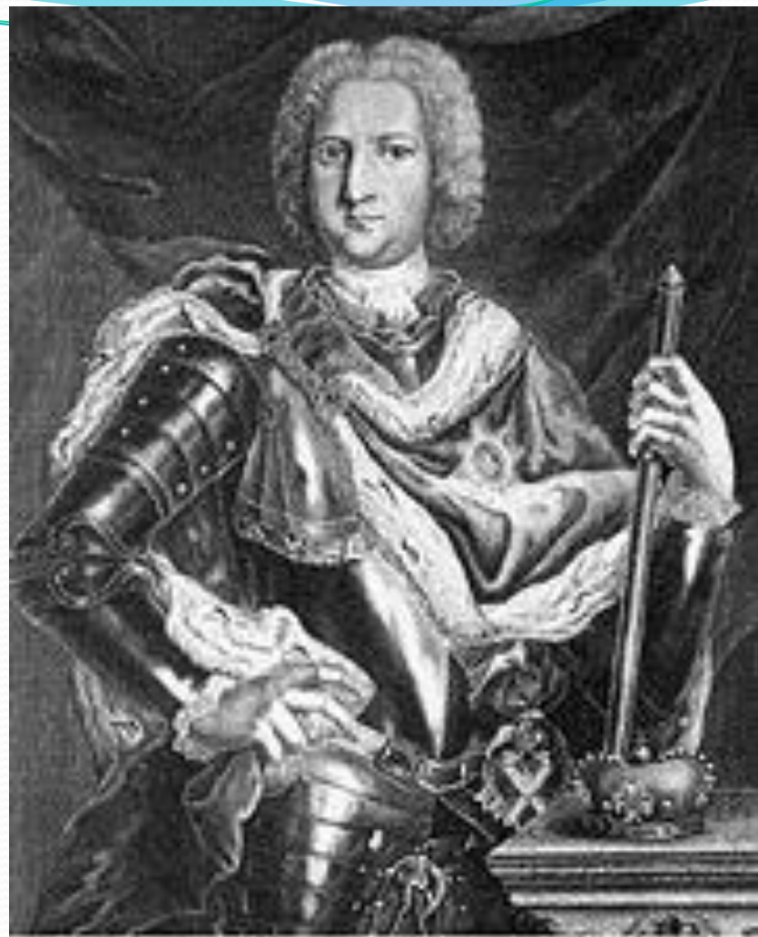
И.Сokolov. Портрет герцога Э.И.Бирона.

Анна Иоанновна окружила себя немцами, главную роль играл её фаворит Бирон (Эрнст Иоганн) – высокомерный, грубый, жестокий временщик. Осенью 1740 г. Анна Иоанновна заболела и наследником провозгласила сына племянницы Анны Леопольдовны - Ивана Антоновича, регентом при младенце назначен был Бирон.