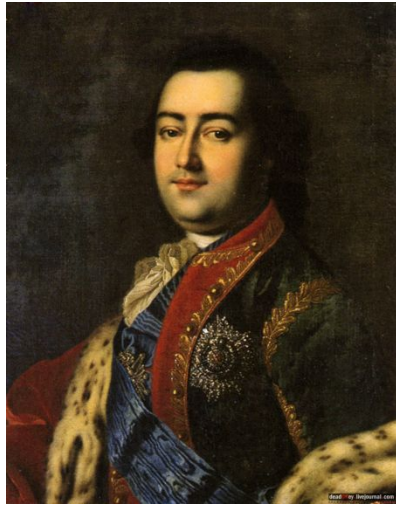
Граф Алексей Разумовский