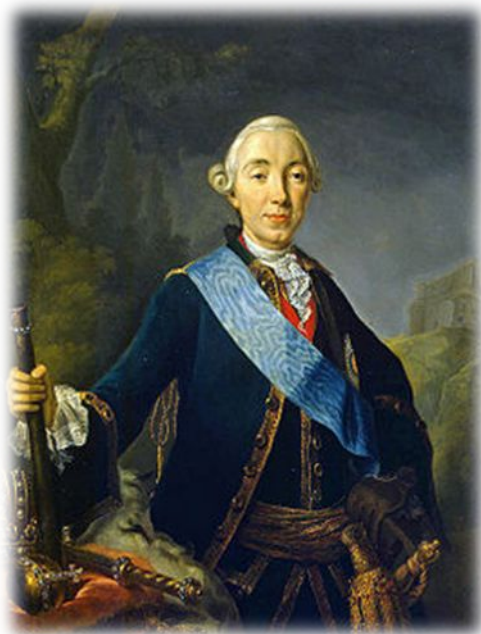
Коронационный портрет императора Петра III Фёдоровича работы Л. К. Пфанцельта

Во время правления Петр III ориентировался на Пруссию.