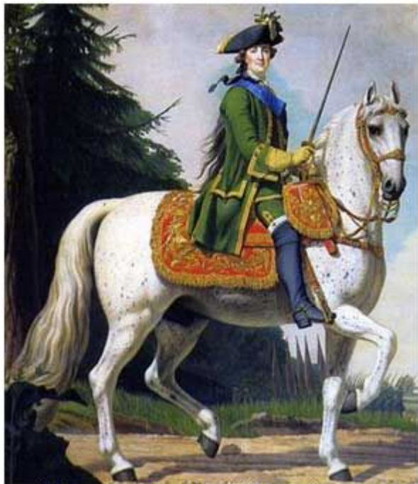
"Поход на Петергоф" (Конный портрет Екатерины Великой) (художник В. Эриксен)

Период правления Екатерины II называют «Просвещенным абсолютизмом» и «Золотым веком дворянства»