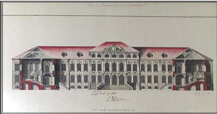
Дворец в Митаве

31 октября 1710 г. была выдана дядей Петром I замуж за герцога курляндского Фридриха Вильгельма. Этот брак был заключен с целью закрепления права России в использовании курляндских (балтийских) портов. Торжества по случаю свадьбы шли два месяца, за это время новоиспеченный муж Фридрих простудился и, выехав с женой в столицу Курляндии Митаву, 9 января 1711 г. умер в 40 км от Петербурга. Несмотря на смерть герцога, Петр приказал Анне жить в Митаве и не позволял ей подолгу гостить в России.