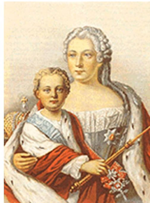
Анна Леопольдовна и Иван Антонович

Император с 1740 года по 1741 год. Сын племянницы императрицы Анны Иоанновны (1693-1740) принцессы Анны Леопольдовны Мекленбургской и принца Антона-Ульриха Брауншвейг-Люнебургского.