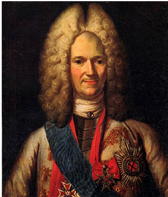
Неизвестный художник. Портрет Александра Даниловича Меншикова. Между 1725 и 1727 гг. Дворец А.Д. Меншикова в Санкт-Петербурге