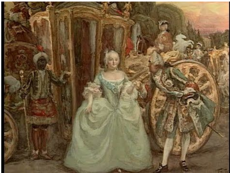
Капитан лейб - гвардии Преображенского полка Императрица Всероссийская Елизавета Петровна