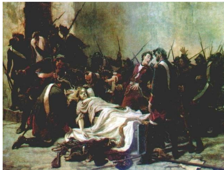
Мирович перед телом Ивана VI. Картина Ивана Творожникова (1884)

Из 24 лет своей жизни, 20 провёл в тюрьме в Шлиссельбургской крепости. В 1764 году при попытке поручика Мировича его освободить, был убит . Тело бывшего императора похоронено в Шлиссельбургской крепости.