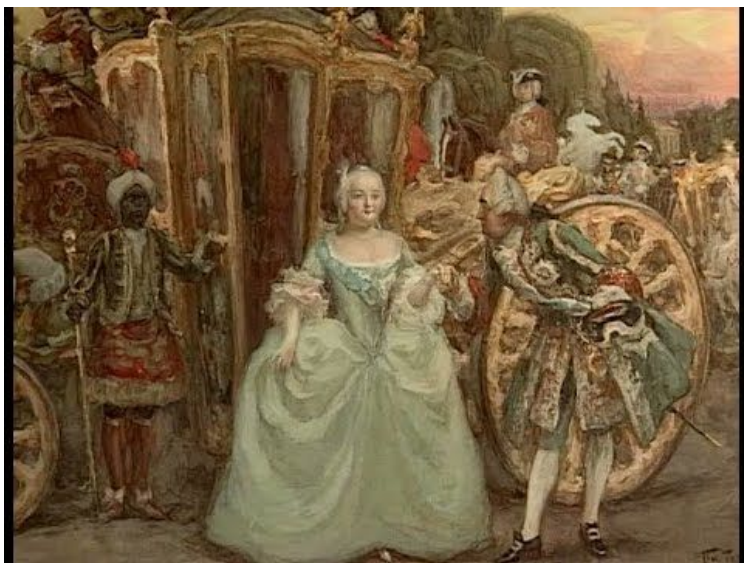
Капитан лейб - гвардии Преображенского полка Императрица Всероссийская Елизавета Петровна

В 1742 завещала престол своему племяннику, сыну дочери Петра Великого Анны, Петру Фёдоровичу.