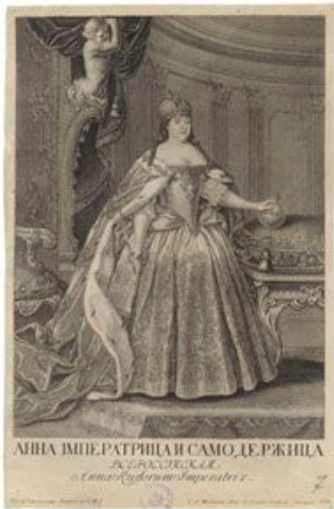
Вортман Христиан-Альберт Портрет Анны Иоанновны

Анна Иоанновна получила корону ценой подписания Кондиций , ограничивающих ее власть в пользу Верховного Тайного Совета .