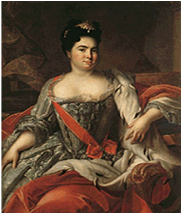
Портрет Екатерины I. Ж.-М. Натье 1717г.