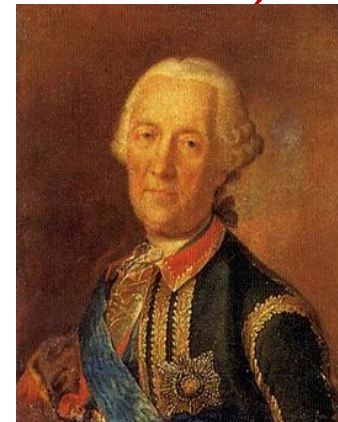
Фельдмаршал Христофор Антонович Миних

В 1741 году в результате дворцового переворота правительница Анна Леопольдовна и малолетний император Иоанн Антонович были свергнуты с престола цесаревной Елизаветой , дочерью Петра Великого