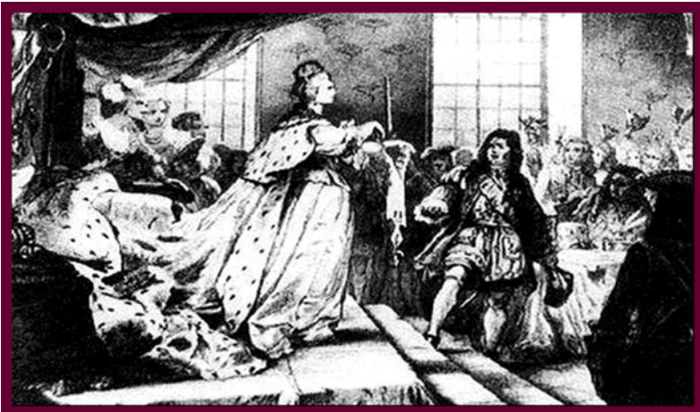
Анна Иоанновна «надрывает» кондиции. Гравюра XVIII в.

Анна согласилась, но по прибытии в Москву, после коронации, почувствовав поддержку гвардии и дворянства разорвала лист с «кондициями», разогнала Верховный тайный совет, вернув абсолютную власть.