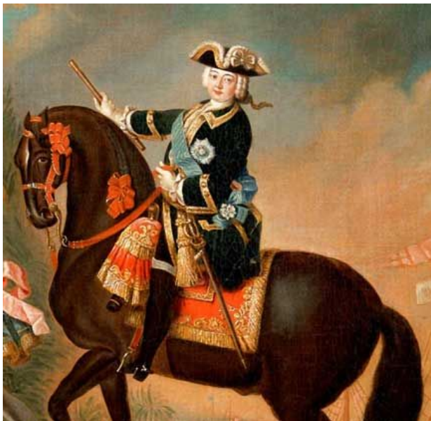
Капитан лейб - гвардии Преображенского полка Императрица Всероссийская Елизавета Петровна