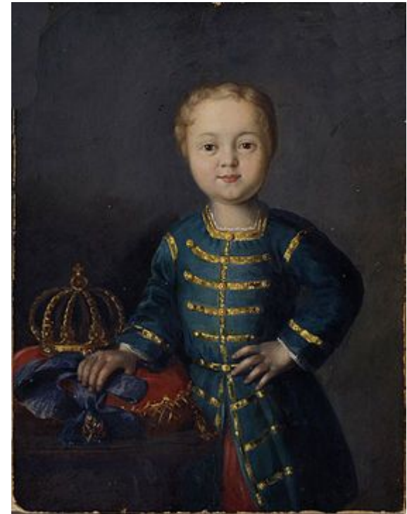
Иван VI Антонович

По завещанию регентом был назначен Э. Бирон. В его руках сосредоточилась реальная власть. Бирон издавал от имени маленького монарха указы.