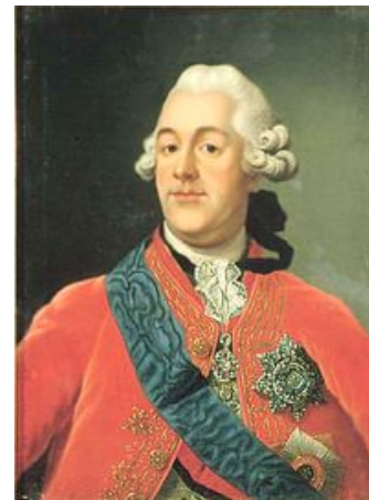
Граф Андрей Иванович Остерман