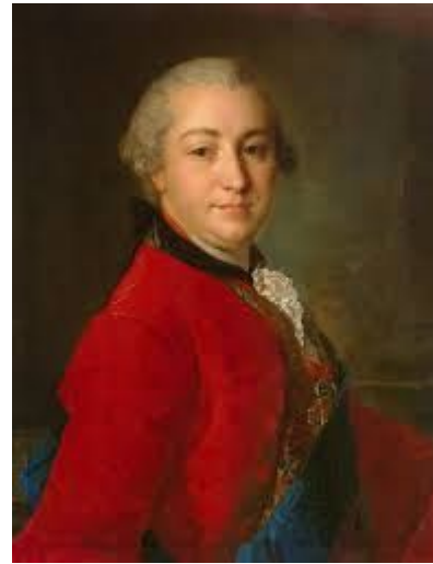
Граф Иван Шувалов

Дочь Петра возвратила на службу петровских вельмож и восстановила действие указов отца.