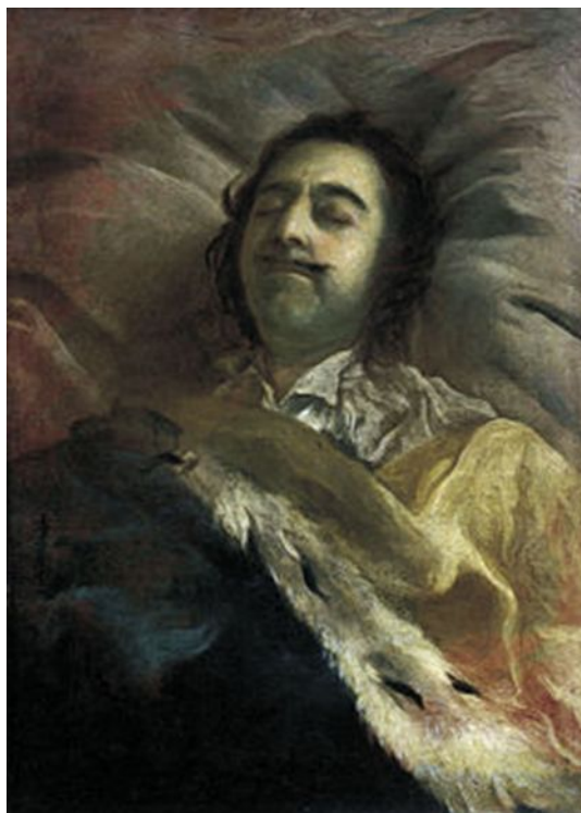
И.Никитин «Пётр I на смертном одре»