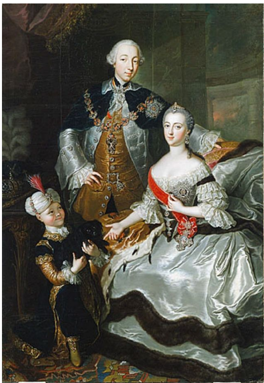
Екатерина и Петр III

Император с 1761 года по 1762 год. Царствовал полгода.