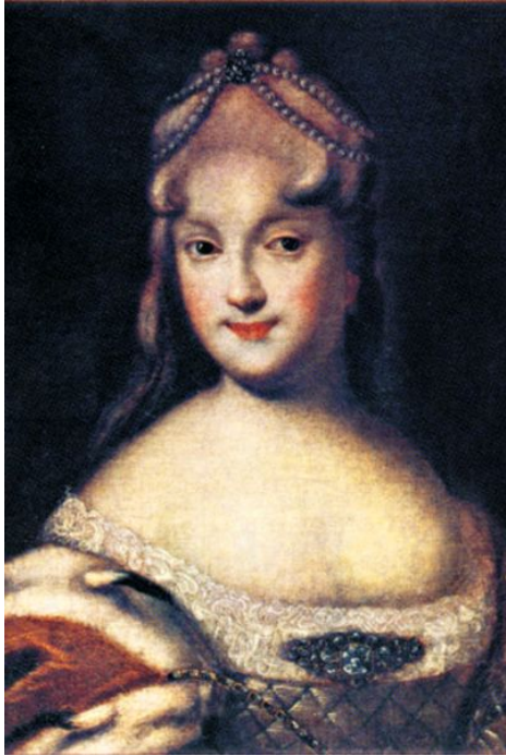
Княжна Екатерина Алексеевна Долгорукова, невеста Петра II. Портрет работы неизвестного художника