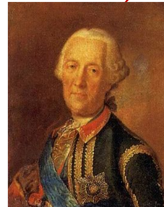
Фельдмаршал Христофор Антонович Миних

В 1741 году в результате дворцового переворота правительница Анна Леопольдовна и малолетний император Иоанн Антонович были свергнуты с престола цесаревной Елизаветой , дочерью Петра Великого