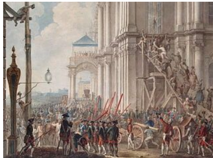
Екатерина II на балконе Зимнего дворца, приветствуемая гвардией и народом в день переворота 28 июня 1762 года