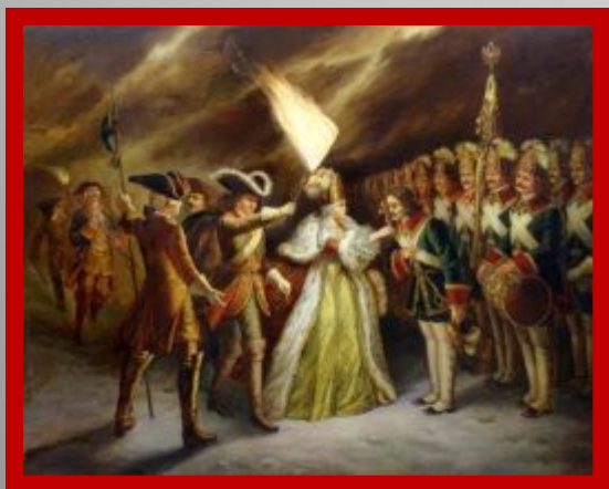
Филипп М.Р. Присяга преображенцев дочери Петра Великого.