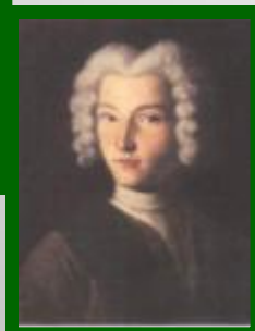
Петр II 1727-1730