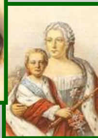
Иван VI Антонович и Анна Леопольдовна 1740-1741