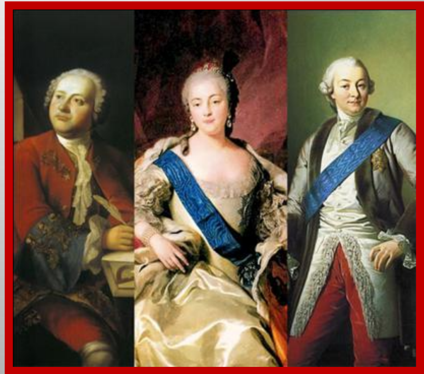
Михаил Васильевич Ломоносов, императрица Елизавета Петровна, Иван Иванович Шувалов.