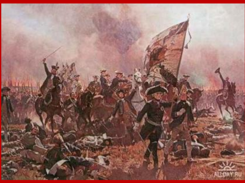
Сражение у Цорндорфа

1761 г. – смерть Елизаветы Петровны. Петр III заключил с Фридрихом II союз против своих бывших союзников и вернул Пруссии все завоевания.