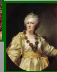
Екатерина II 1762-1796