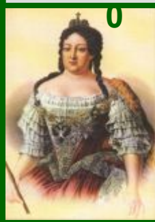
Анна Иоаннов на 1730-1740