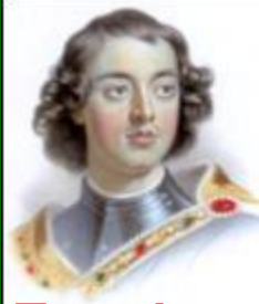
Петр I 1682-1725

Период в истории России с 1725 по 1762 гг.