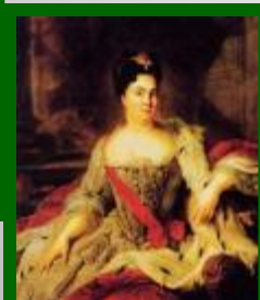
Екатери на I 1725-1727