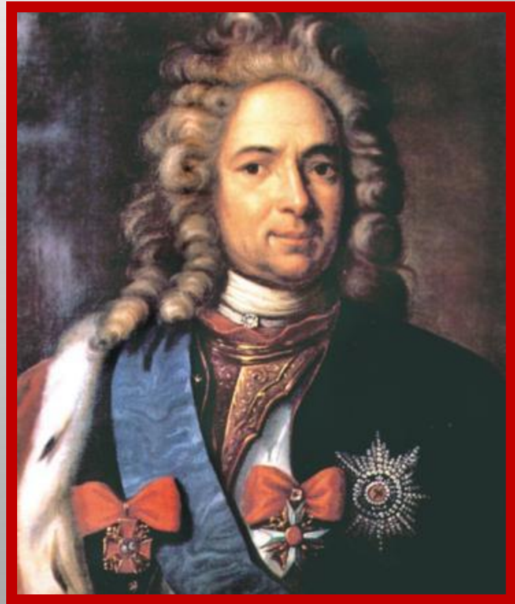
Александр Данилович Меншиков