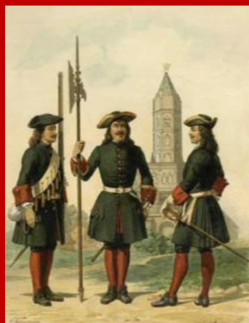
Уддман — Серингетъ — Офицеры Пресекрещеннаго полка. 1695 — 1700 г.