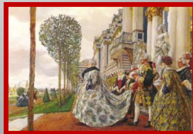
Императрица Елизавета Петровна в Царском Селе Е. Е. Лансере