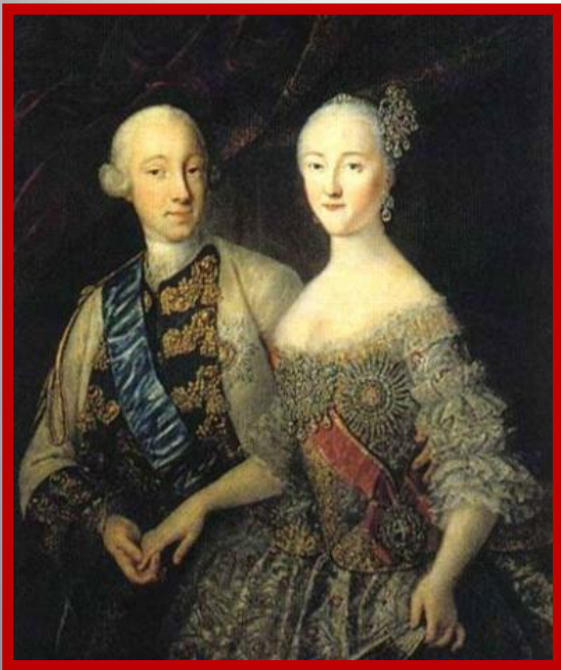
Петр Федорович, великий князь, Екатерина Алексеевна, великая княгиня.