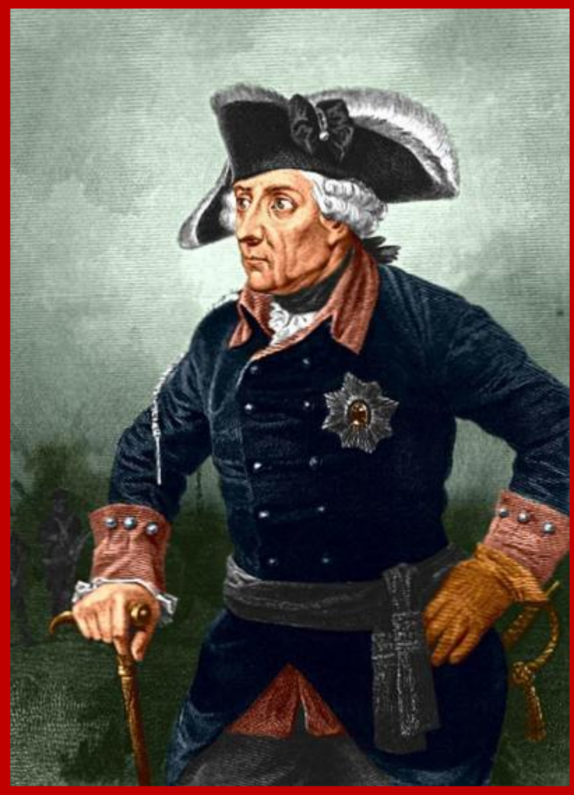
Прусский король Фридрих II

24 апреля 1762 года - Петербургский мирный договор между Россией и Пруссией, заключённый Петром III, поклонником Фридриха II Прусского. •Россия выходила из Семилетней войны и добровольно возвращала Пруссии территорию, занятую русскими войсками, включая Восточную Пруссию.