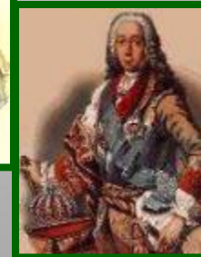
Петр III 1761-1762