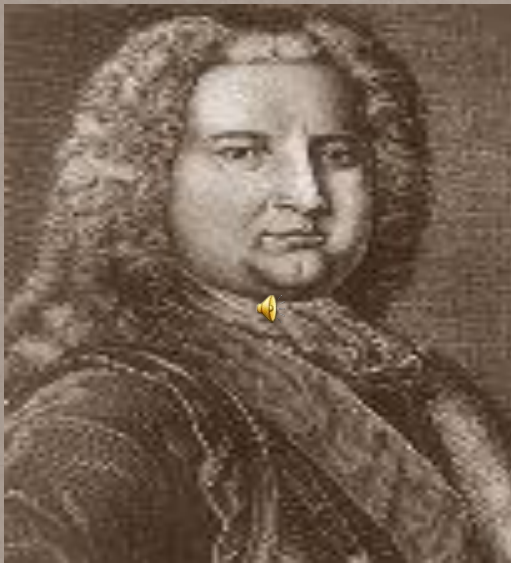
Эрнст Иоганн Бирон