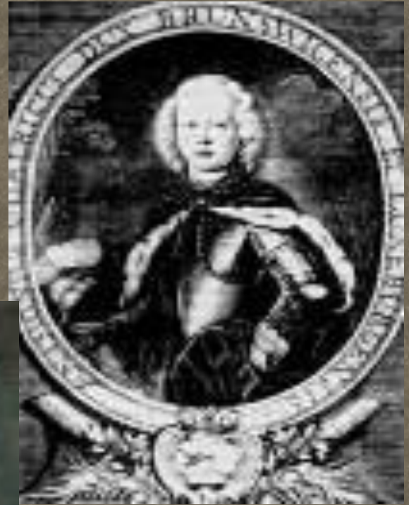
Антон Ульрих Брауншвейгский