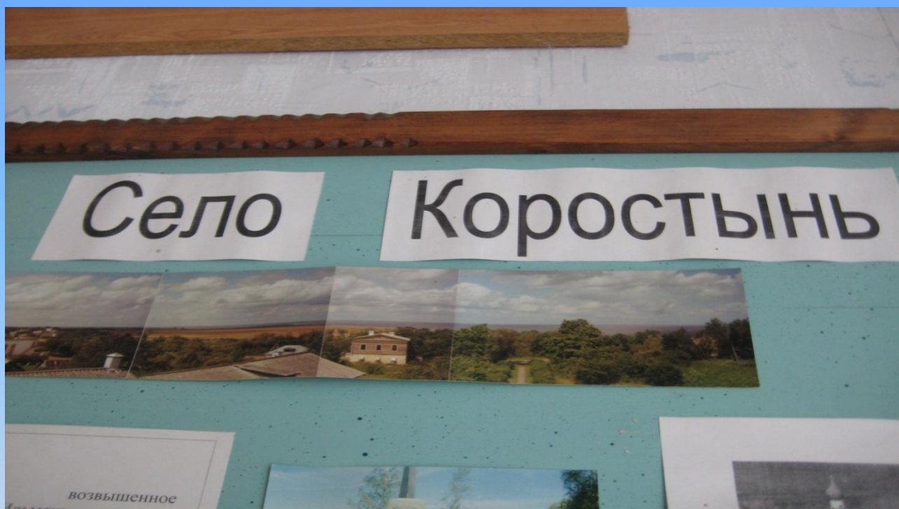
2. Село Коростынь. Выставка Коростынского краеведческого музея в школе №1