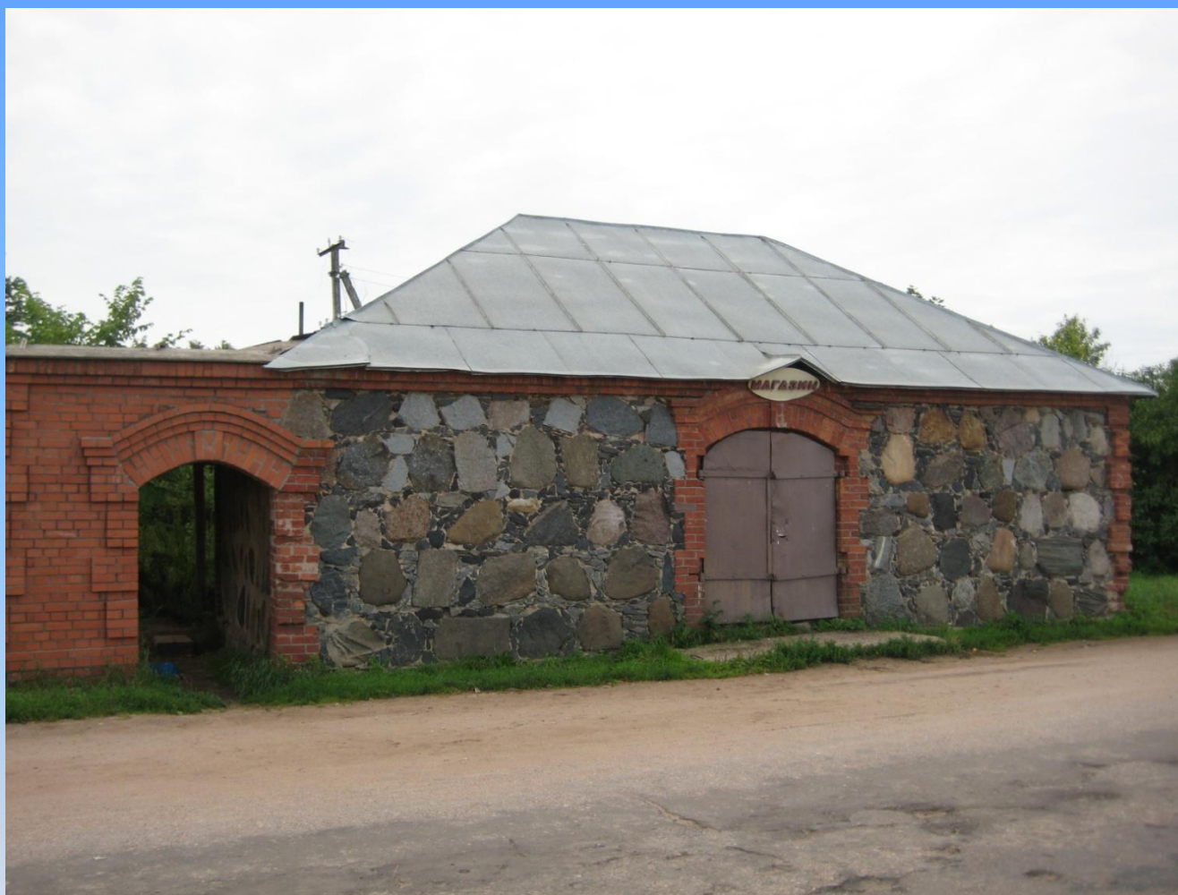
12. Амбар рядом с Путевым дворцом.