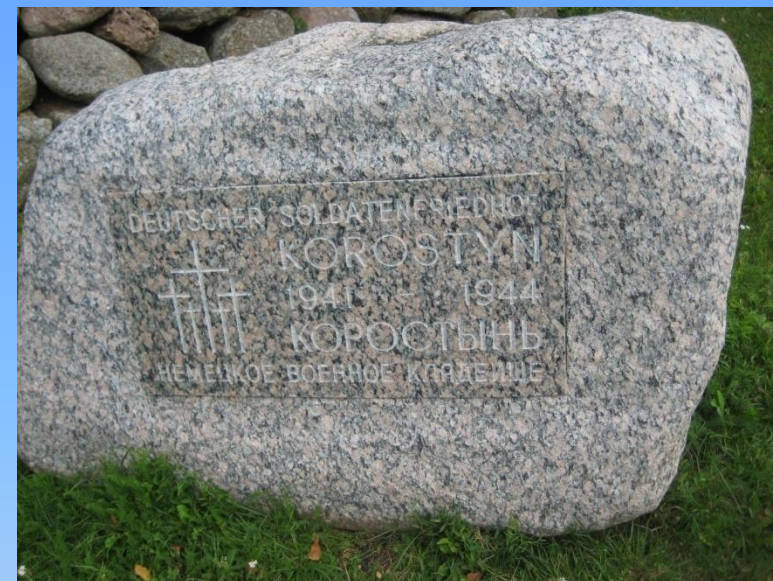
9. Памятный камень на немецком кладбище