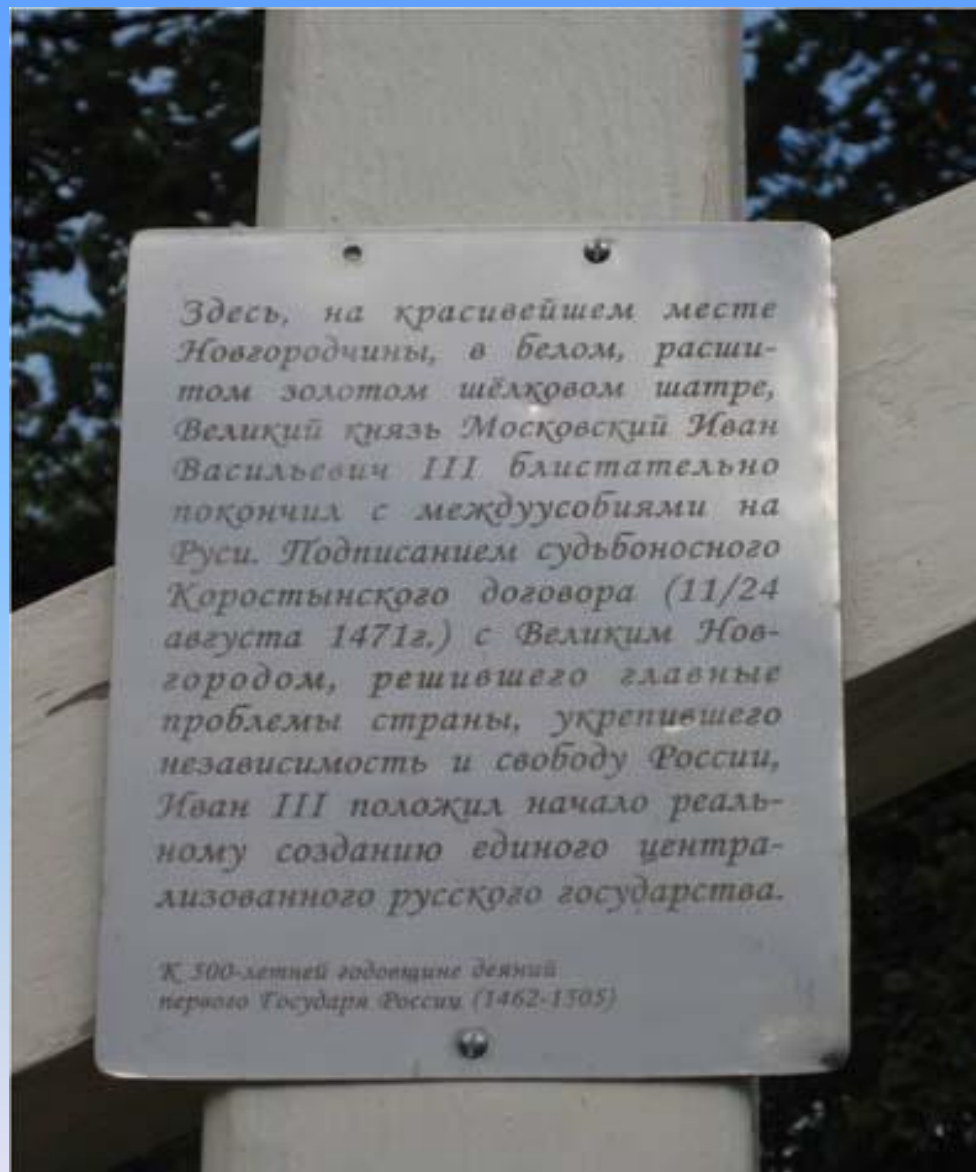
5. Надпись на памятном кресте