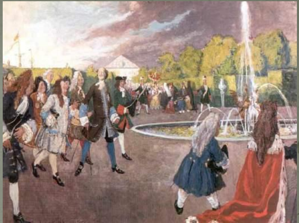
Бенуа «Петр Первый на прогулке»

За сим, с Богом, вперёд !!! Сию заповедь применять постоянно, а не вспоминать какой пункт, стоя чурбаном посреди веселья.