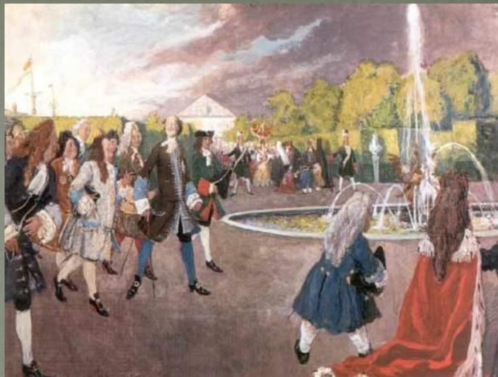
Бенуа «Петр Первый на прогулке»

За сим, с Богом, вперёд !!! Сию заповедь применять постоянно, а не вспоминать какой пункт, стоя чурбаном посреди веселья.