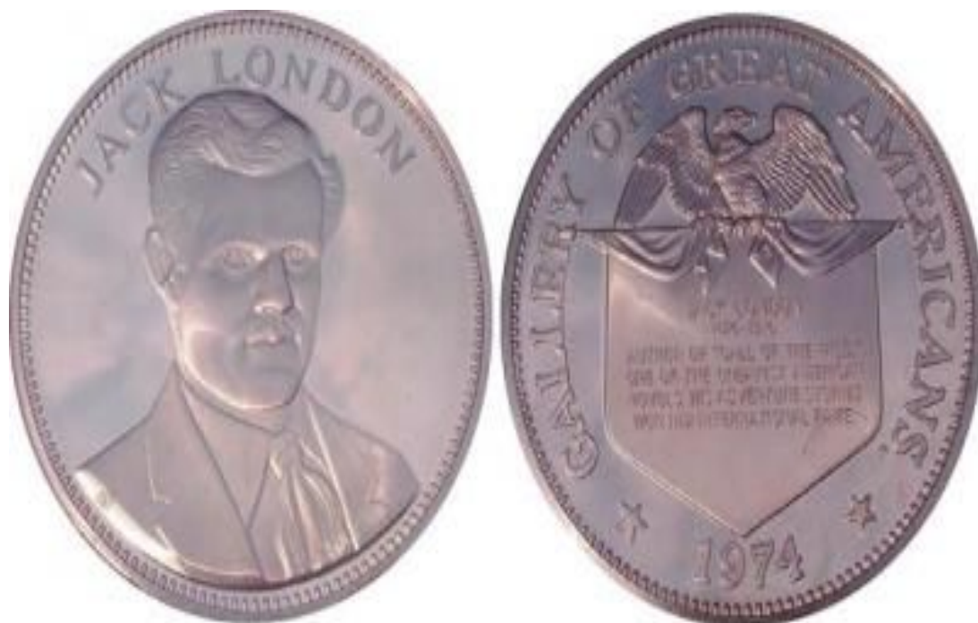
памятная медаль в честь Джека ЛОНДОНА