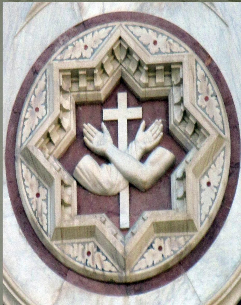
Карпини был спутником Франциска Ассизского — основателя ордена францисканцев