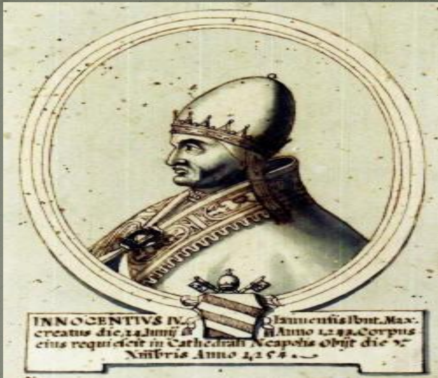
Приближенный папы Иннокентия IV