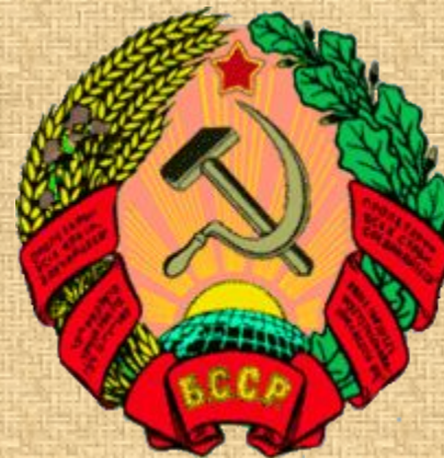
Герб Беларускай ССР 1926—1937 гг.