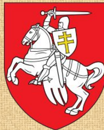
Герб Беларусі 1991—1995 гг.