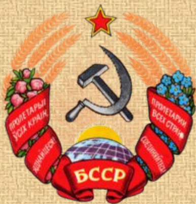
Герб Беларускай ССР 1950—1991 гг.