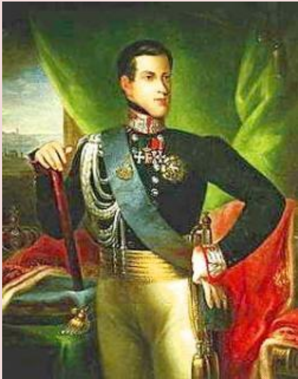
Карл Альберт Савойский.

1849 г. – новая война и снова неудача. Карл Альберт отрекся от престола в пользу сына Виктора Эммануила II, который подписал мирный договор с Австрией.