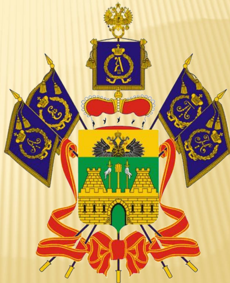
Герб Краснодарского края Признан 22 июня 2004г.