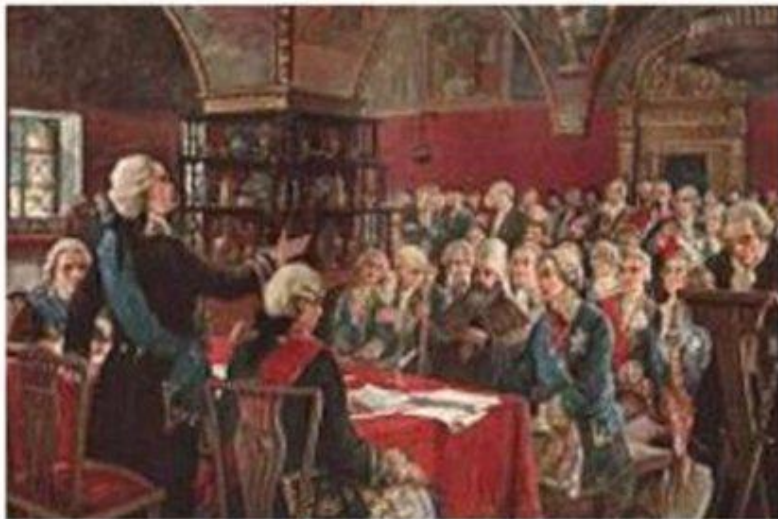
Матвей Зайцев. Екатерининская комиссия 1767 года