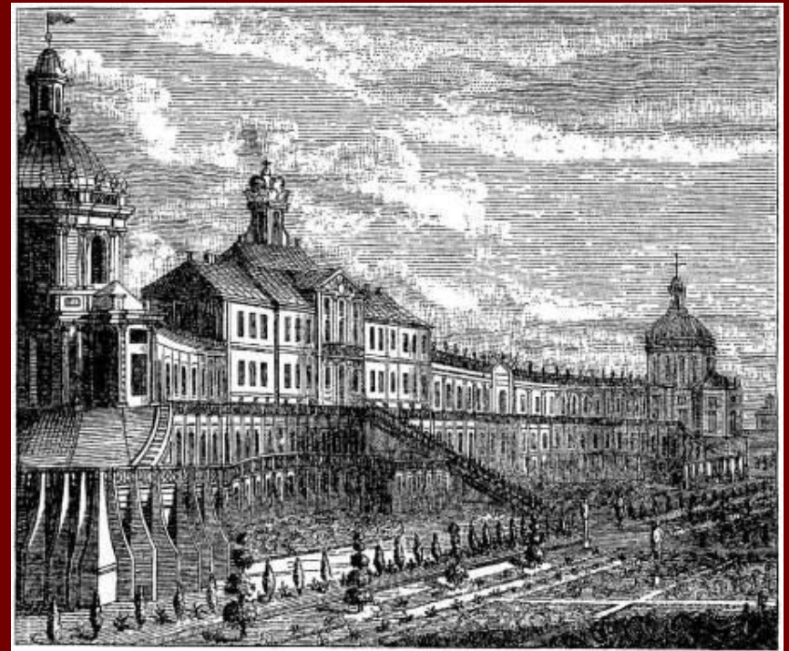
Петербург 18 в.