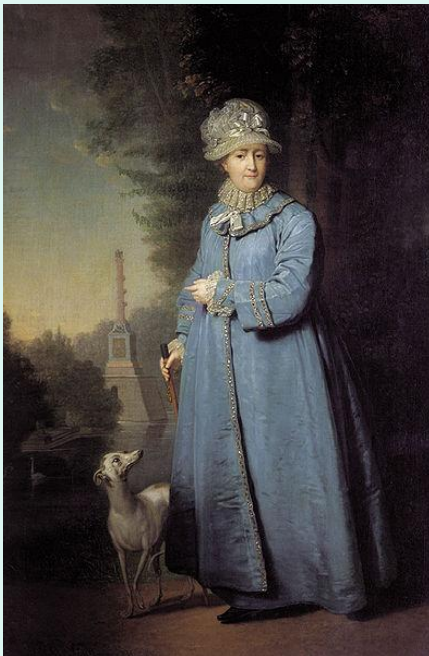
Екатерина II на прогулке