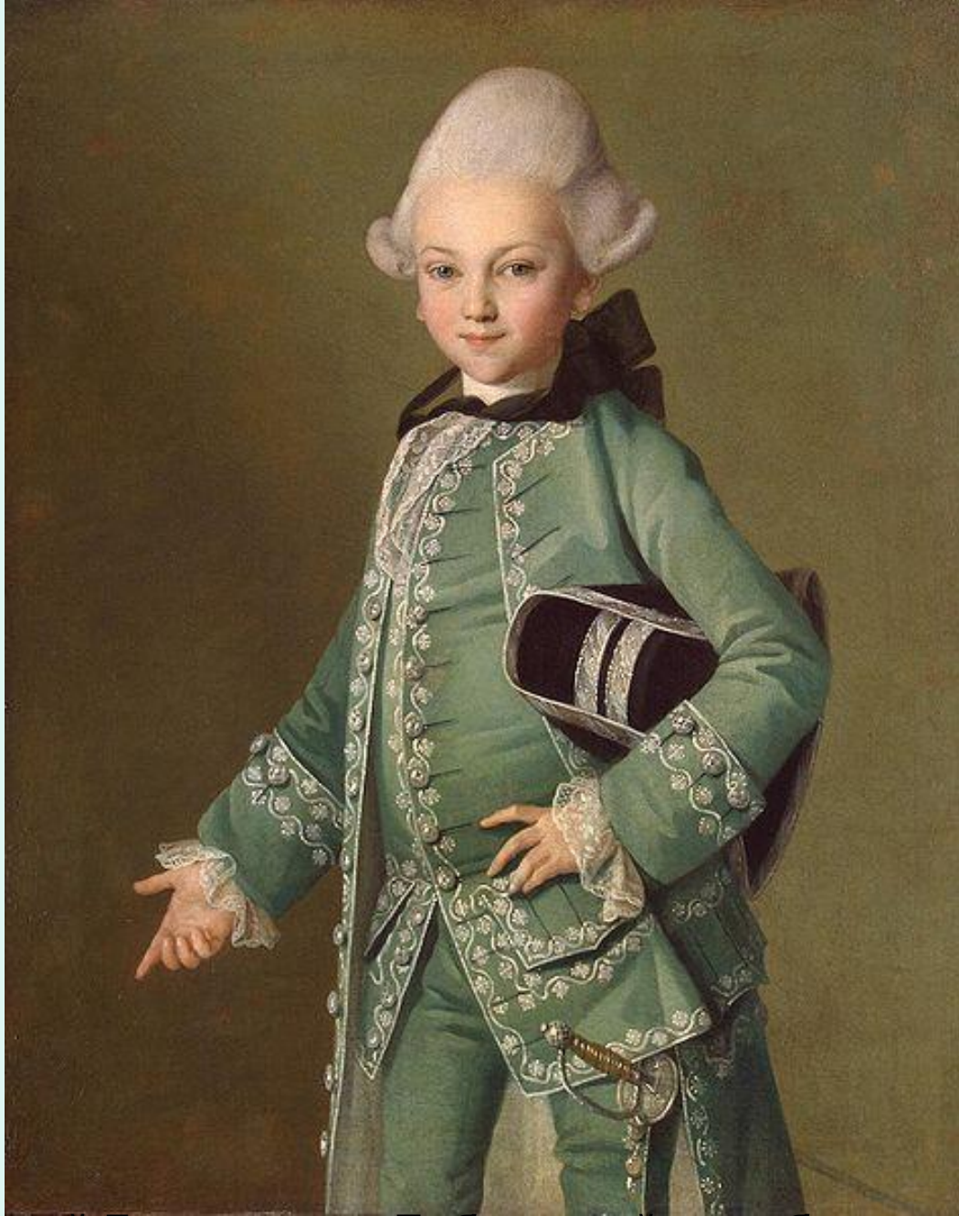
Алексей Григорьевич Бобринский – внебрачный сын императрицы