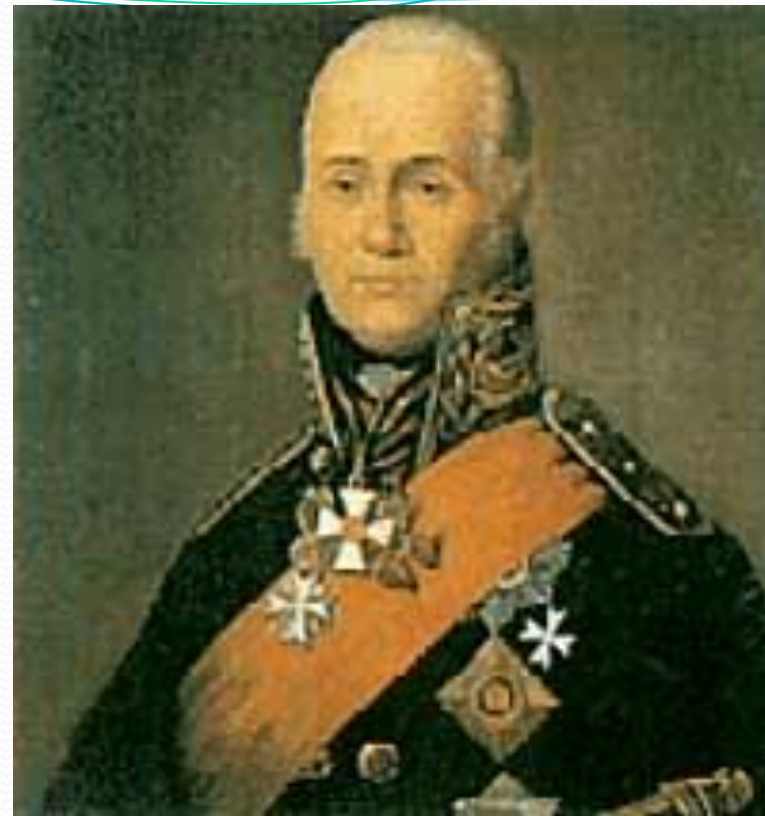
Г.А. Спиридов и Ф.Ф. Ушаков