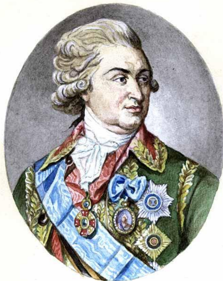
А. Г. Потёмкин

Фавориты – лица, пользующие благосклонностью правителя.