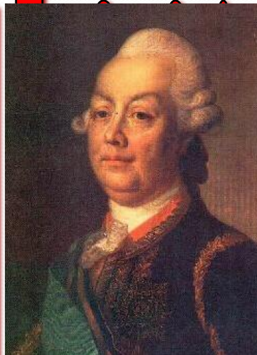
А.В. Суворов и П.А. Румянцев