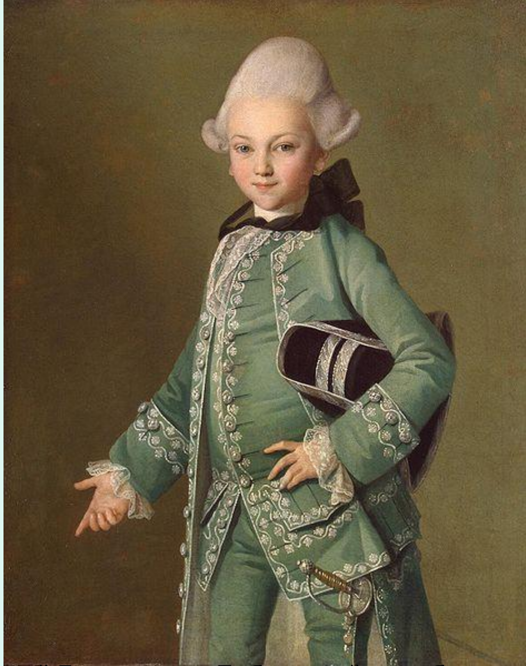
Алексей Григорьевич Бобринский – внебрачный сын императрицы