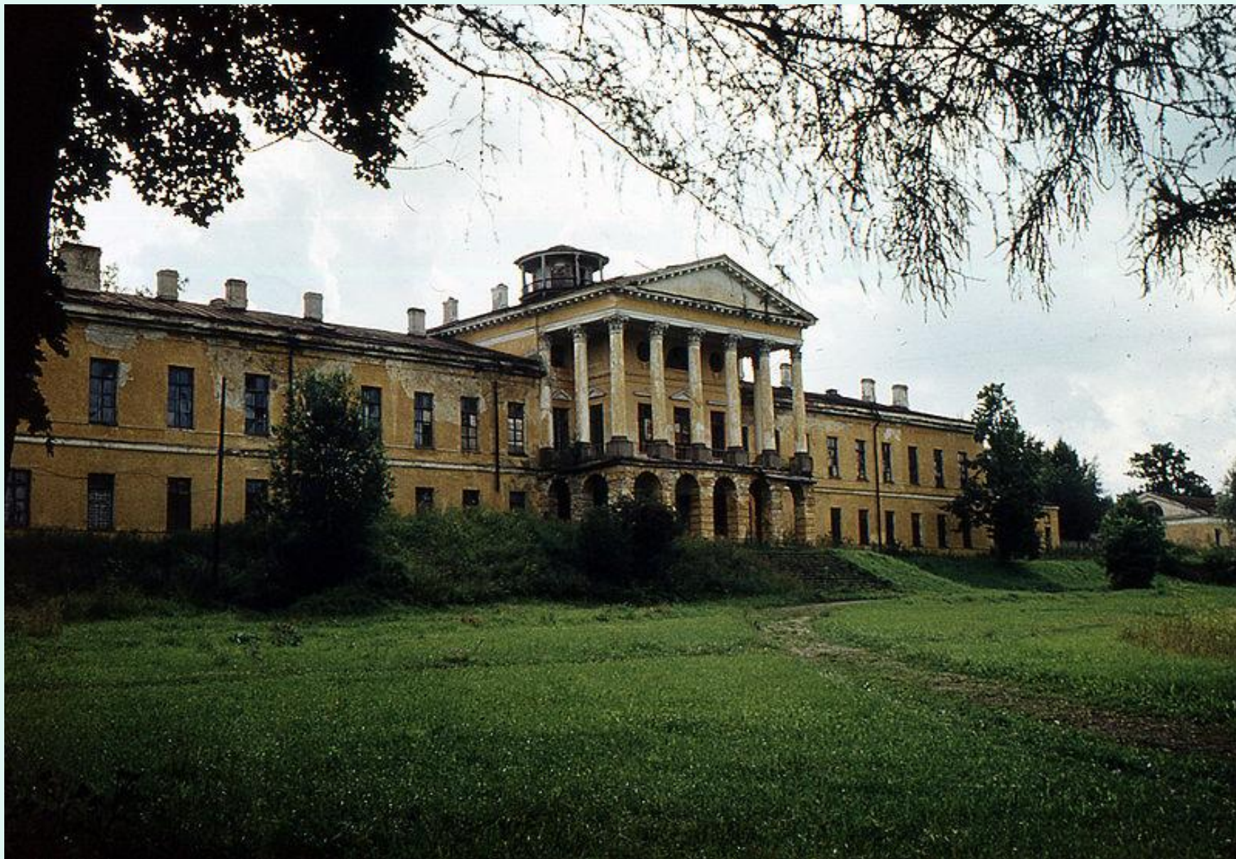
Дворец в Ропше, здесь погиб Петр III