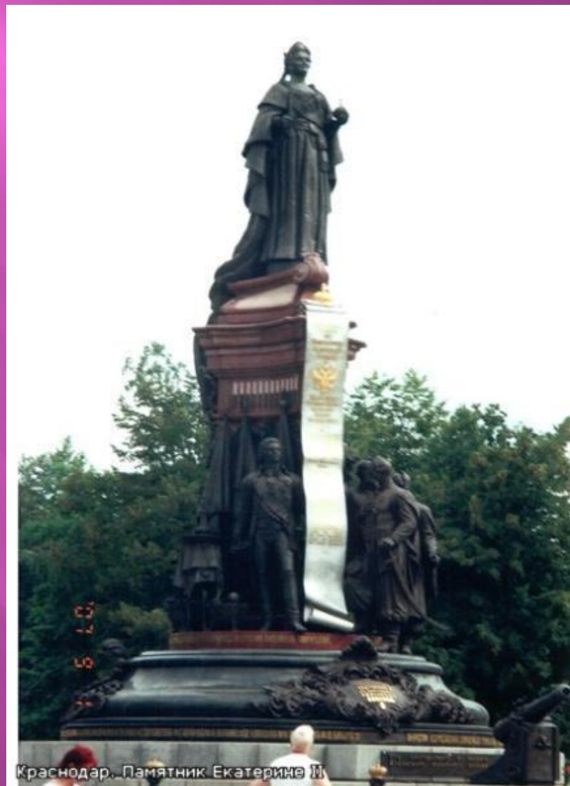
Краснодар. Памятник Екатерине II