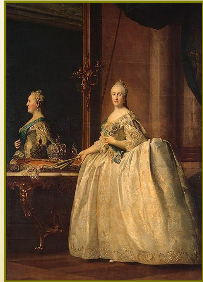
Екатерины II перед зеркалом Эриксен Виргилиус

Время Екатерины II — это расцвет фаворитизма. Расставшись с Г. Г. Орловым, императрица сменила целый ряд фаворитов. Со своими фаворитами Екатерина жила по несколько лет. Все они были щедро награждены. Всю свою жизнь Екатерина искала