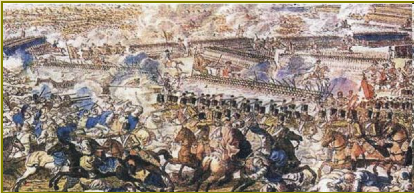
Кинбурнская баталия. Русско-турецкая война 1787-1792 гг.

Начата Турцией с целью возвращения Крыма и других территорий. Победы русских войск под командованием А. В. Суворова, Г. А. Потемкина, Н. В. Репнина, Ф. Ф. Ушакова. Завершилась Ясским миром (1791 г.). Вторая русско-турецкая война (1787-1791 гг.) утвердила за Россией обладание Новороссией, Крымом и крепостью Очаков.