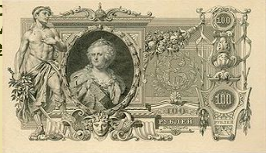
Екатерина Великая на катеньке — царской сторублёвке 1898 г. и 1910 г.

34-летнее царствование Екатерины II оставило яркий след в истории России. Бросается в глаза неординарность личности императрицы, ее выдающиеся качества государственного деятеля и величие ею содеянного: Петр Великий утвердился на берегах Балтики, Екатерина Великая — на берегах Черного моря, раздвинув границы на юг и включив в состав империи Крымский полуостров. Именно поэтому, чтобы увековечить ее имя, в 1898 и 1910 гг. были выпущены монеты номиналом 1 рубль, на которых изображена Екатерина Великая.