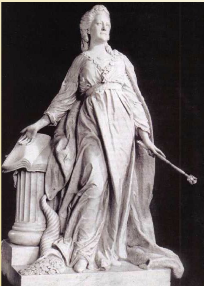
Федот Шубин. Екатерина II - законодательница. 1789-90 гг.

Екатерина любила балы, маскарады, развлечения, но при этом была натурой деятельной. "Для Екатерины жить смолоду означало работать", - писал В. О. Ключевский.