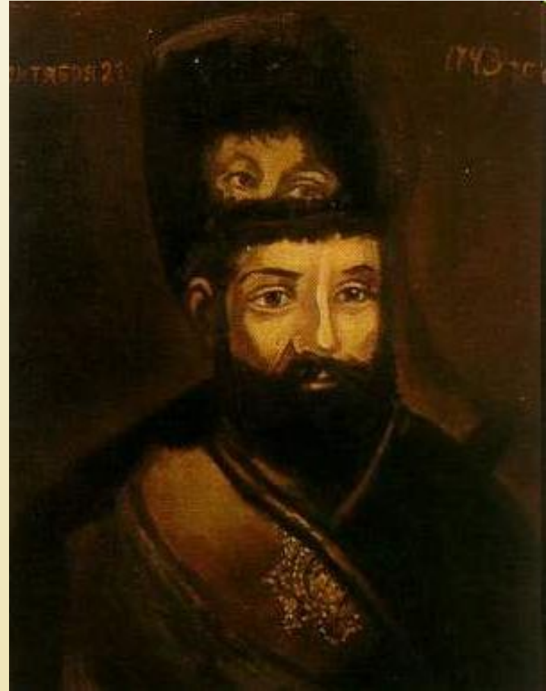
Портрет Е. И. Пугачёва, написанный по портрету Екатерины II.

После разгрома Пугачева Екатерина II использовала все возможности для