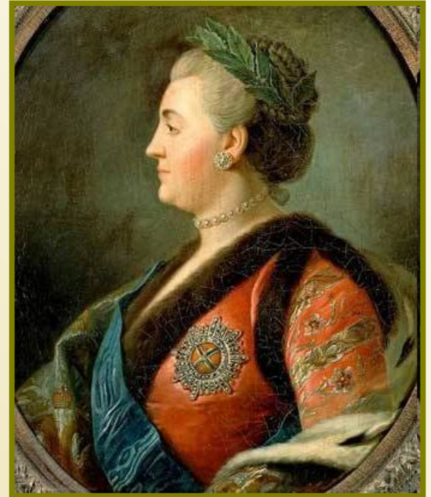
В ходе Русско-турецкой войны 1768-1774 гг.

В 1772-1774 гг. русская армия одержала победы при Ларге и Кагуле, выиграла морское сражение в Чесменской бухте. По мирному договору с Турцией России отошло побережье Черного и Азовского морей. Турция признала независимость Крыма. Русский торговый флот получил право свободного прохода