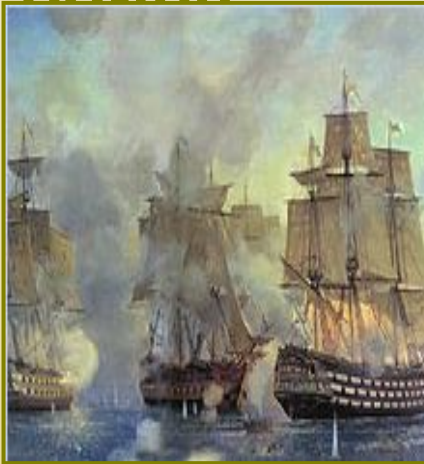
В. Пен. «Гогландское сражение 6 июня 1788 г».

В 1788 - 90 гг. началась война со Швецией, с попытки Швеции вернуть бывшие владения в Прибалтике. Победы русского флота в Гогландском (1788 г.), Выборгском (1790 г.) сражениях; неудача шведского наступления в Финляндии.