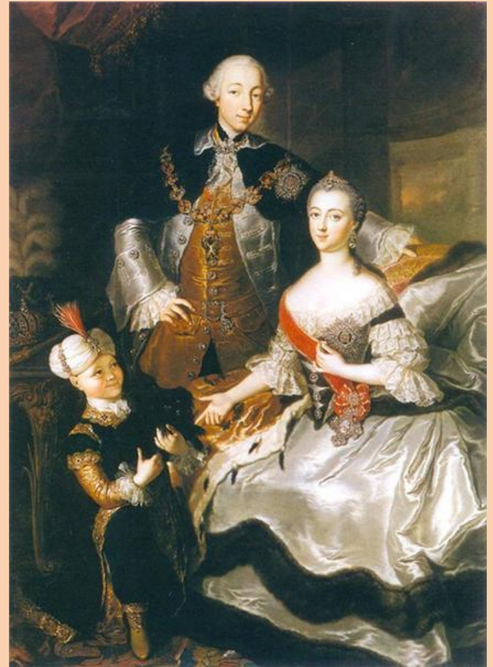
Великая княгиня Екатерина Алексеевна с супругом Петром III Фёдоровичем