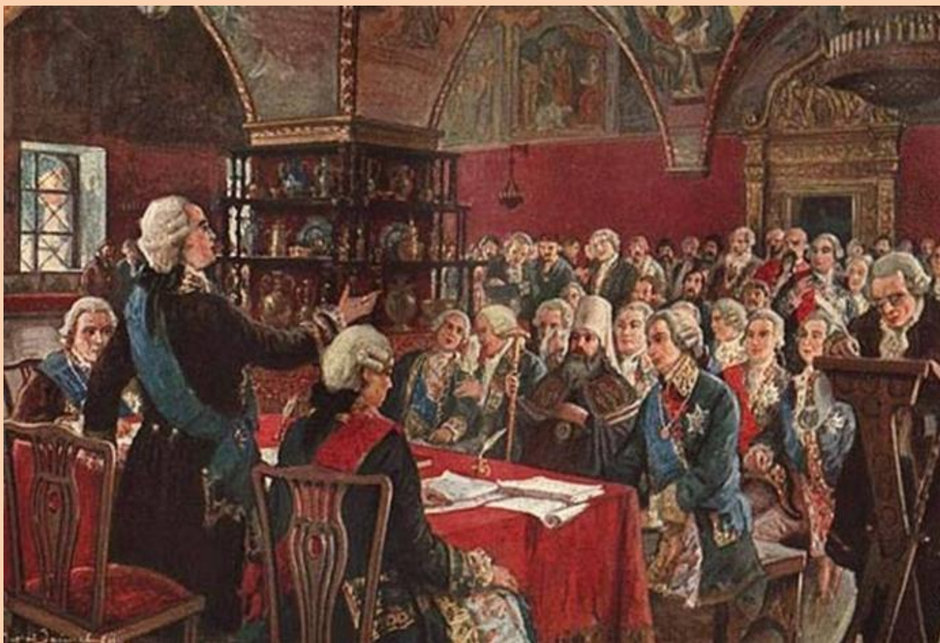
Матвей Зайцев. Екатерининская комиссия 1767 года