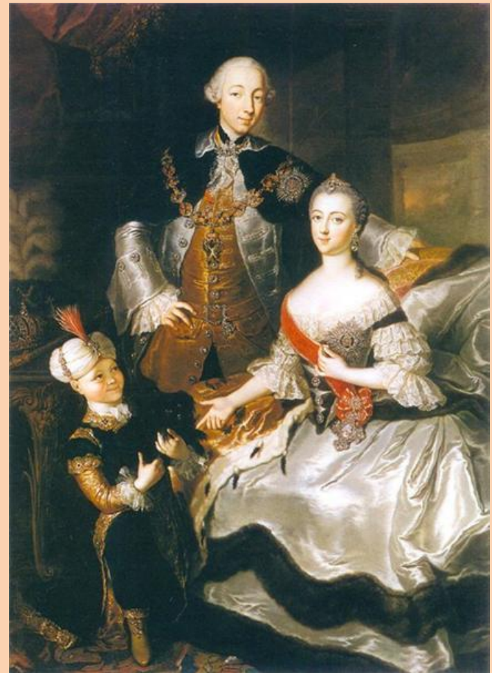
Великая княгиня Екатерина Алексеевна с супругом Петром III Фёдоровичем