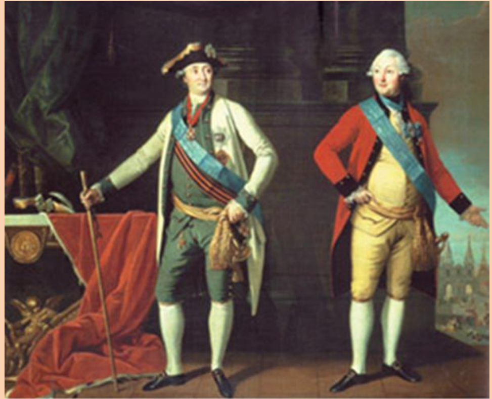
Ж.Л. де Велли. Граф А.Г. Орлов-Чесменский и его брат князь Г.Г. Орлов, удостоенный золотой медали за избавление Москвы от моровой язвы в 1771 г.

Ранним утром 28 июня 1762 г., пока Пётр III находился в Ораниенбауме, Екатерина в сопровождении Алексея и Григория Орловых приехала из Петергофа в Санкт-Петербург, где ей присягнули на верность гвардейские части