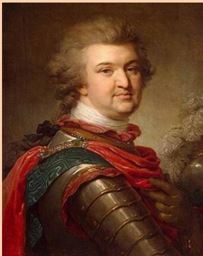
Г. А. Потёмкин