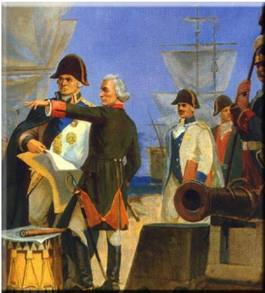
А.В.Суворов и Ф.Ф. Ушаков

В период царствования Екатерины II Россия вела продолжительные войны, в первую очередь за выход к Чёрному морю. В этой войне русскими войсками руководили А. С. Суворов и Ф. Ф. Ушаков.