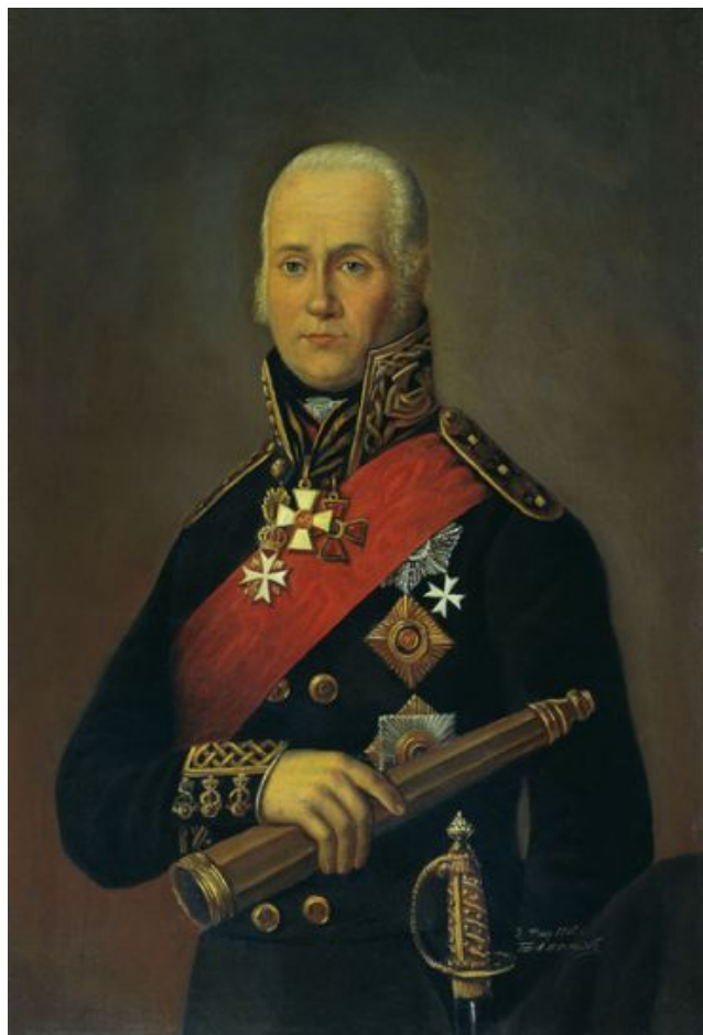
Адмирал Фёдор Фёдорович Ушаков

Биография Ф. Ф. Ушакова схожа с биографией А. В. Суворова: он начал службу с низшего в России воинского офицерского чина – капрала. Как и Суворов, в 1799 году Ушаков получил высший чин флотоводца – адмирал за взятие крепости Корфу и победы на Средиземном море над французами. Выше оставался только чин генерал – адмирала, который давался членам царской семьи.