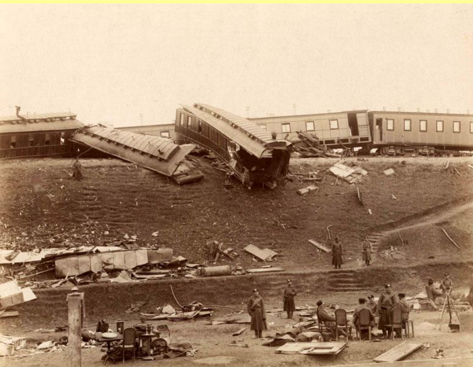
Катастрофа императорского поезда близ ст. Борки Курско-Харьковско- Азовской железной дороги. 17 октября 1888 г.

В 1888 г. императорский поезд потерпел катастрофу близ станции Борки. Крушение было следствием чрезмерно высокой скорости тяжелого царского поезда, которого легкие рельсы и деревянные шпалы не выдержали.