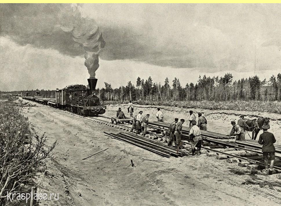
Строительство Транссибирской магистрали

В 1891 г. началось строительство Транссибирской магистрали, не имевшее в мире аналогов по протяженности пути, размаху и сложности работ. Со второй половины 90-х гг. железные дороги, прежде убыточные, стали давать казне чистый доход.