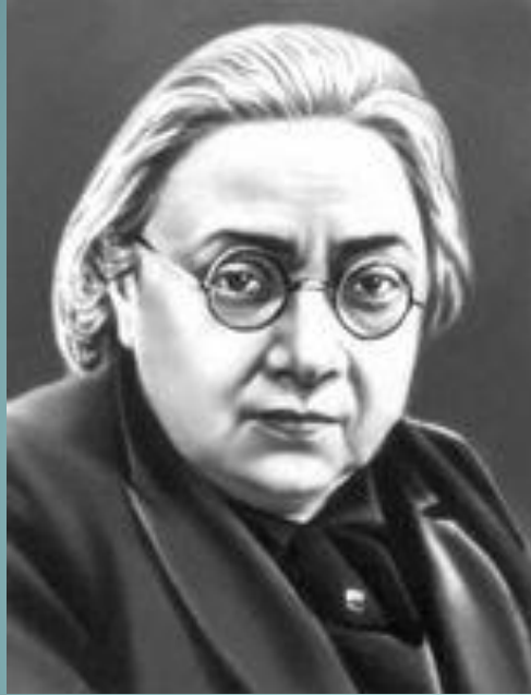
Н.К.Крупская- жена Ленина, революционерка.

● 2. 2 декабря 1918 распущены комитеты бедноты. В связи с продовольственной диктатурой участились крестьянские бунты. По мнению Н.К.Крупской «комбеты насильничают и безобразят, в деревне раскол, участились случаи самосуда над властью». Большевики решили вернуть утраченное в деревне доверие политикой умиротворения. 11 января 1919 г. издан «Декрет о разверстке хлеба и фуража». Он предусматривал брать с «бедняка- ничего, середняка- умеренно, кулака- много». На деле же по продразверстке, изымались не только излишки хлеба, но и необходимый запас. В 1920 г. продразверстка распространилась на картофель и другие культуры.