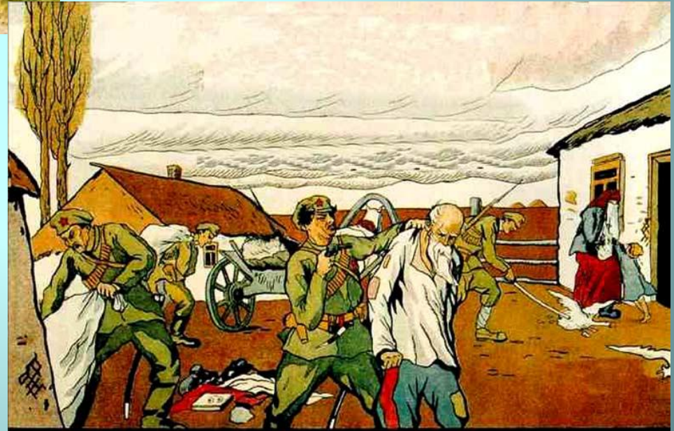
ТАКЪ ХОЗЯЙНИЧАЮТЪ БОЛЬШЕВИКИ ВЪ КАЗАЧЬИХЪ СТАНИЦАХЪ.