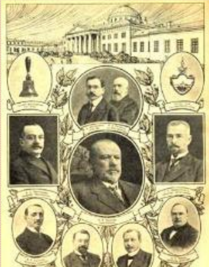
Президиум IV Думы.