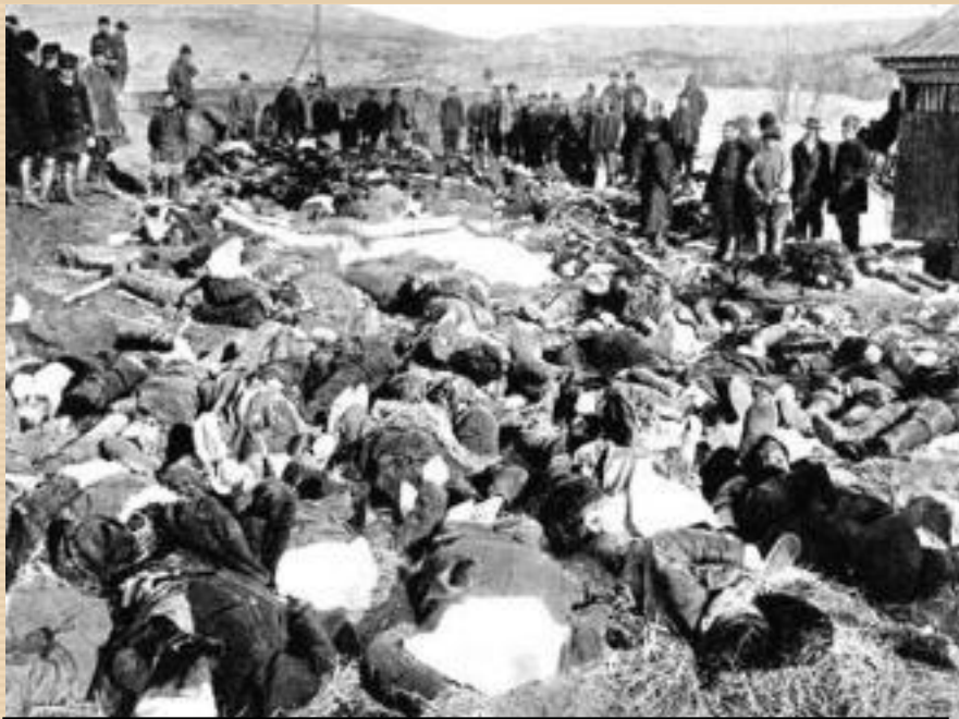
Жертвы Ленского расстрела

После убийства Столыпина стало ясно, что политических реформ ждать не следует и это привело к оживлению революционного движения. В ответ правительство перешло в наступление. Был изменен университетский устав. В знак протеста группа виднейших профессоров Московского университета объявила об отставке.