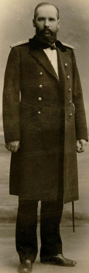
П. А. Столыпин—Гродненский губернатор, в 1902 г.