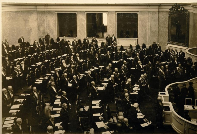
П. А. Столыпин в Государственном Совете на открытии заседаний в новом зале Маринского Дворца.

3 июня 1907 г. был создан новый избирательный закон, сохранивший деление на 4 курии. Но изменилось число выборщиков в пользу землевладельцев.