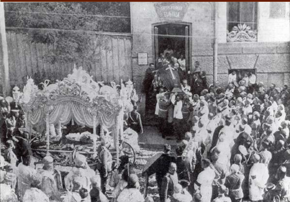
Выносъ тѣла П. А. Столыпина изъ больницы бр. Маковскихъ.