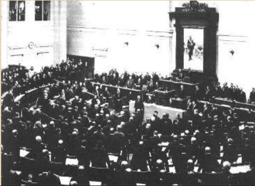
III Дума обсуждает «финский» вопрос.

В Думе предпринимались попытки ликвидировать права окраин, дарованные во время революции. В 1909 г. образовалась фракция националистов, ставшая опорой Столыпина. В 1910 г. Дума приняла закон, фактически урезавший финскую автономию. В ответ на протесты финнов, Николай II распустил финский Сейм.