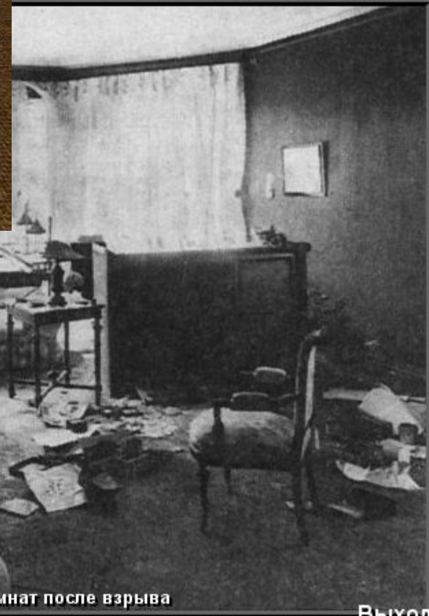
Одна из комнат после взрыва