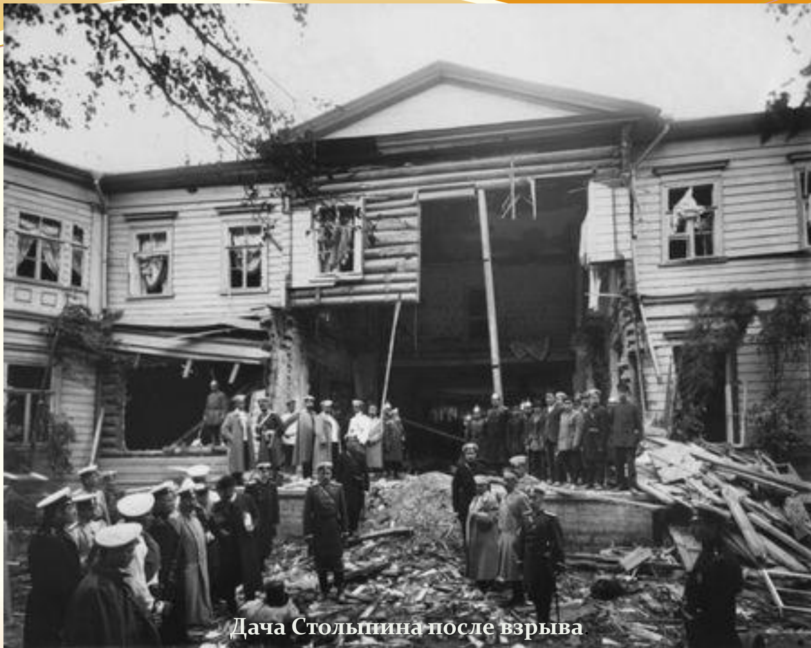
Дача Столыпина после взрыва.