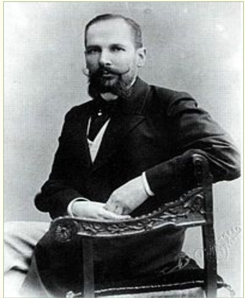
Гродненский губернатор Столыпин в 1902 году