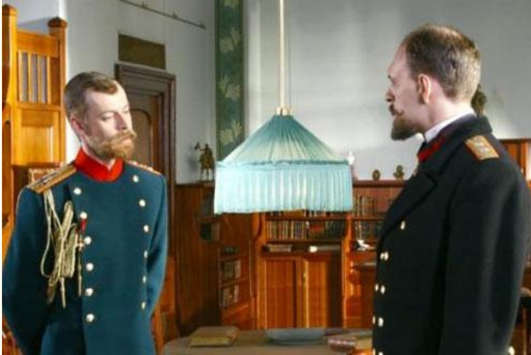
П.А. Столыпин и Николай II