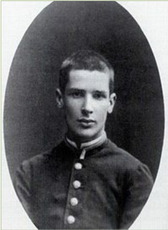
Ученик Виленской гимназии П. А. Столыпин. 1876 год

2 (14) апреля 1862 – 5 (18) сентября 1911 гг.