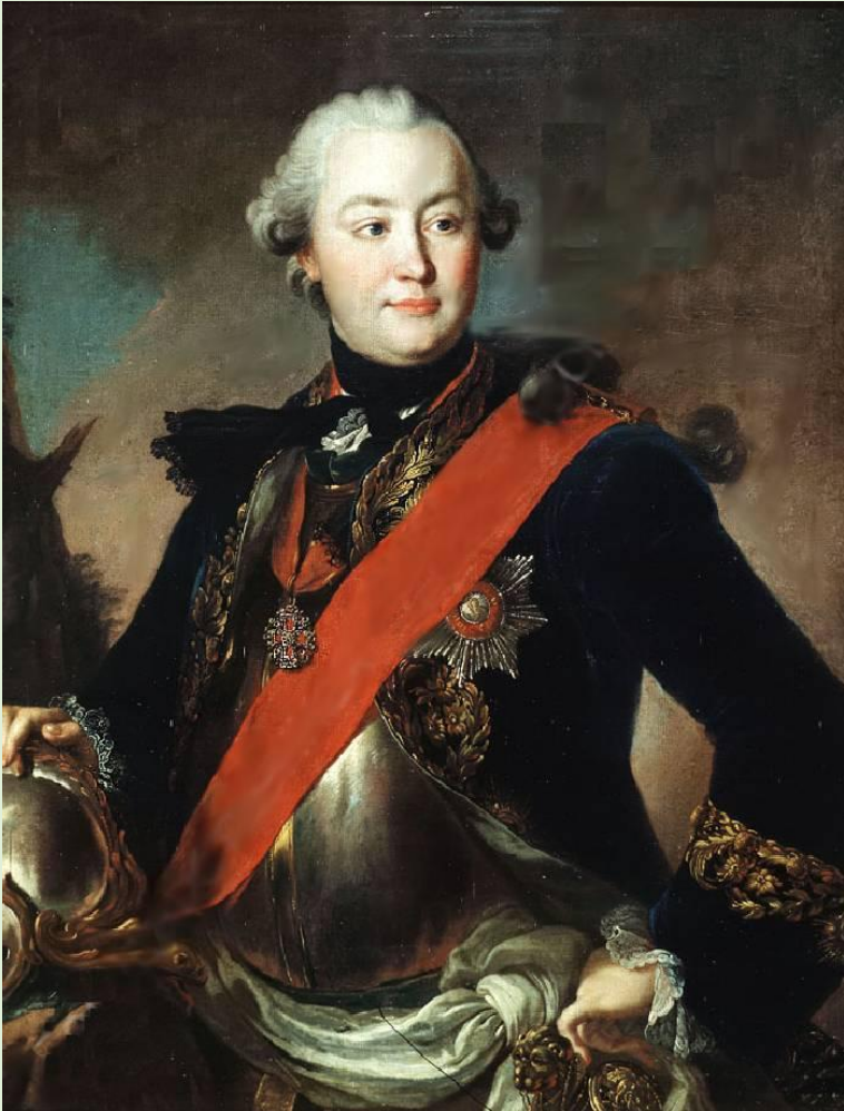
Ф. Рокотов Портрет графа Г. Г. Орлова в латах