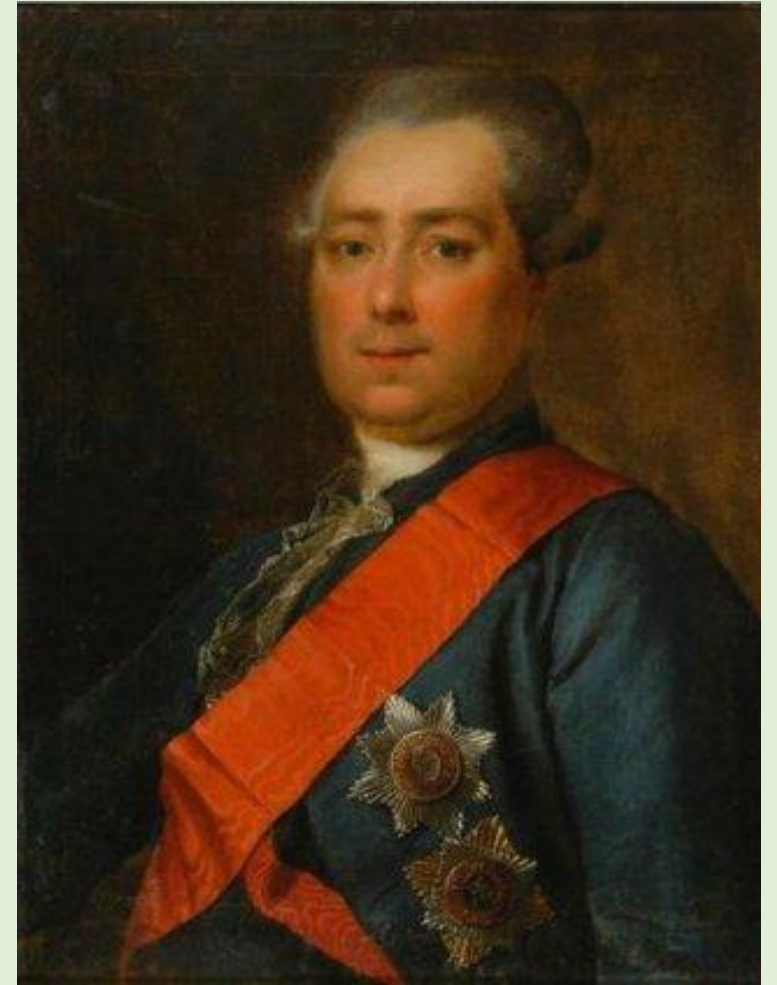
Неизвестный художник Портрет графа А. Р. Воронцова