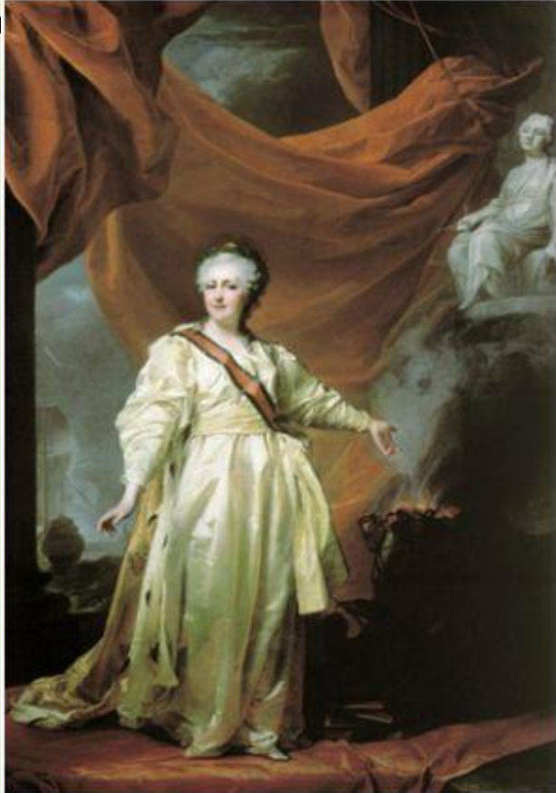
Д.Г. Левицкий Портрет Екатерины II в виде законодательницы в храме богини Правосудия

Цель: оказание помощи помещикам в освоении новейшего зарубежного и опыта ведения хозяйства.