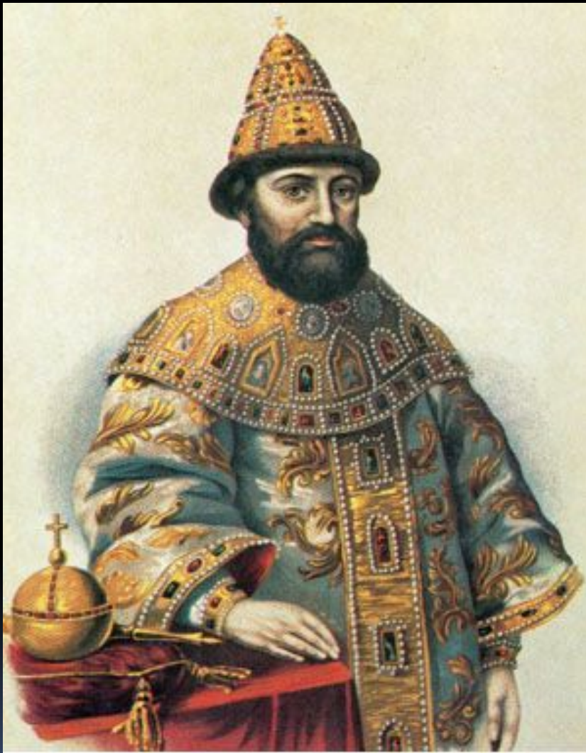
Михаил Фёдорович (1596-1645)

– Первый русский царь из династии Романовых. Был избран Земским собором на царствование в 1613г, что положило конец смутному времени.