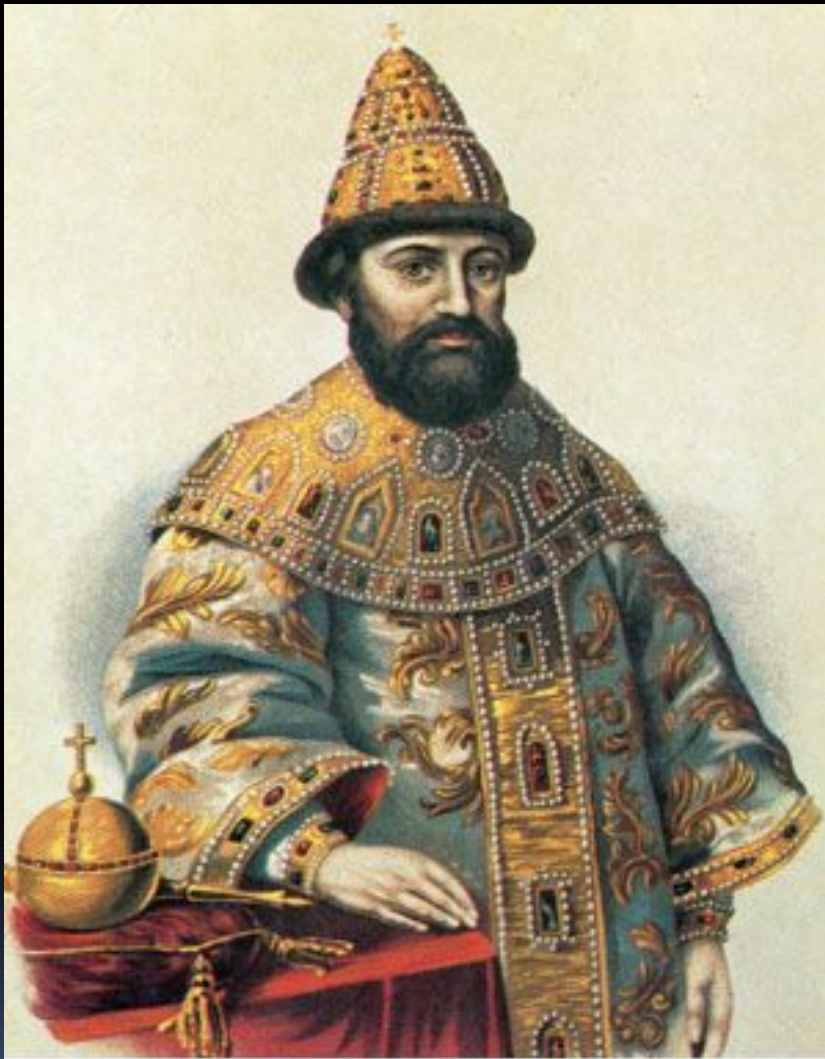
Михаил Фёдорович (1596-1645)

– Первый русский царь из династии Романовых. Был избран Земским собором на царствование в 1613г, что положило конец смутному времени.