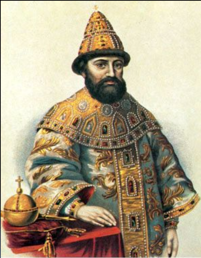
Михаил Фёдорович (1596-1645)

– Первый русский царь из династии Романовых. Был избран Земским собором на царствование в 1613г, что положило конец смутному времени.