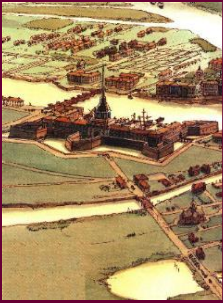
«Санкт-Петербург в 18 в». (Фрагмент).

Внутри страны торговля шла не только на сельских торжках, но и на крупных ярмарках. Для облегчения торговли были построены Вышневолоцкой и Ладожский каналы.