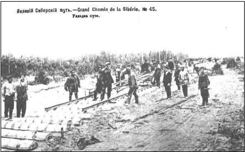
Великий Сибирский путь.—Grand Chemin de la Sibérie. № 45. Укладка пути.