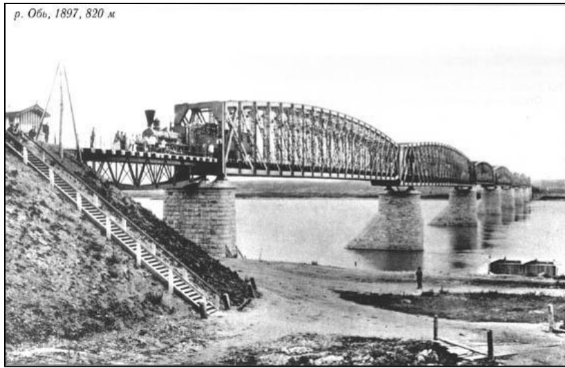
р. Обь, 1897, 820 м