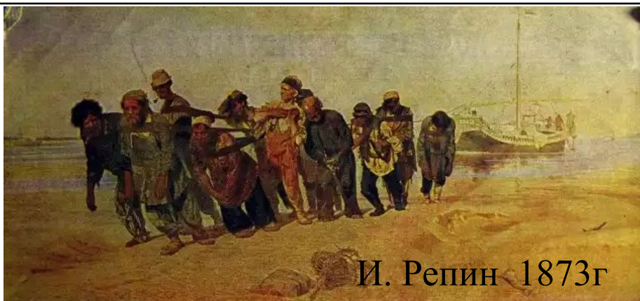
И. Репин 1873г

Баржи, которые по берегу с помощью ремней тянули бурлаки со скоростью 5 -10 верст в сутки.