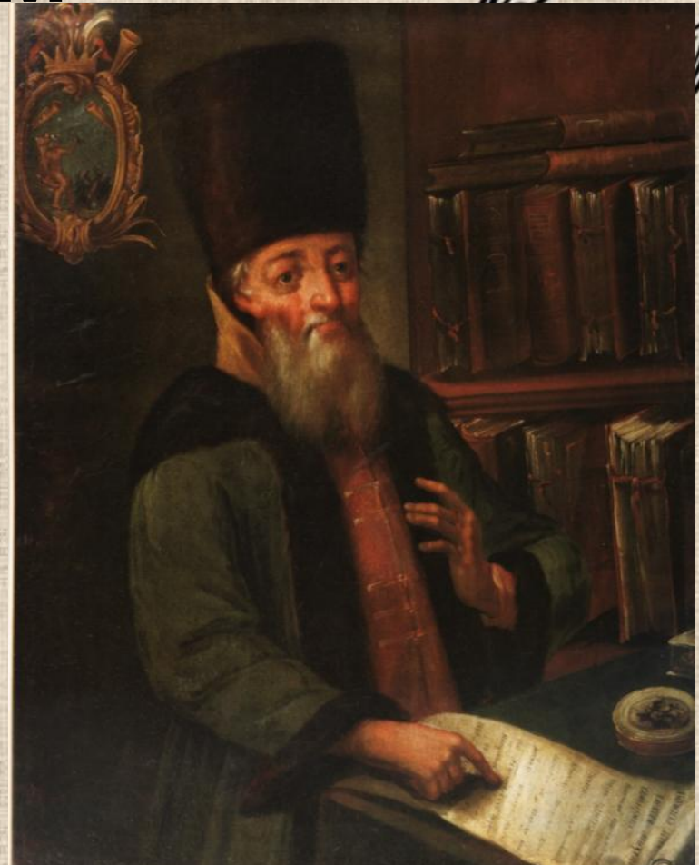
Инициатор принятия Новоторгового Устава А.Л. Ордин-Нащокин