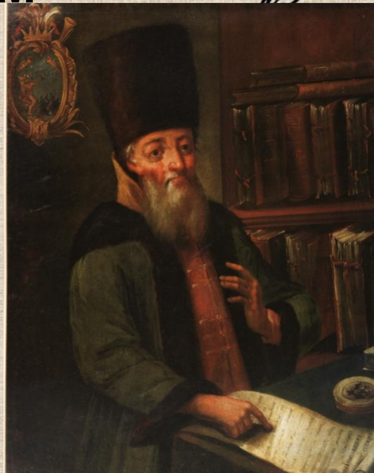
Инициатор принятия Новоторгового Устава А.Л. Ордин-Нащокин