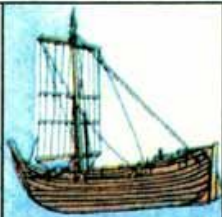
Мореходное русское судно