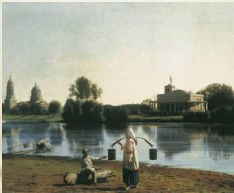
Художник Григорий Васильевич Сорока

Сельское хозяйство в 60—90-х годах развивалось довольно успешно.