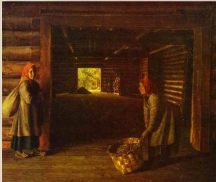
Художник Григорий Васильевич Сорока

Это было связано не с новыми формами труда, а с освоением новых земель, которые Россия завоевала в Северном Причерноморье