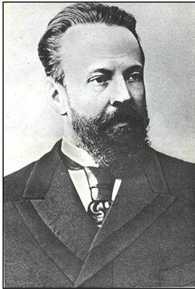
С.Витте. Министр финансов империи в 1892—1903 гг.

Отставание аграрного сектора, со- хранение феодалных пережитков