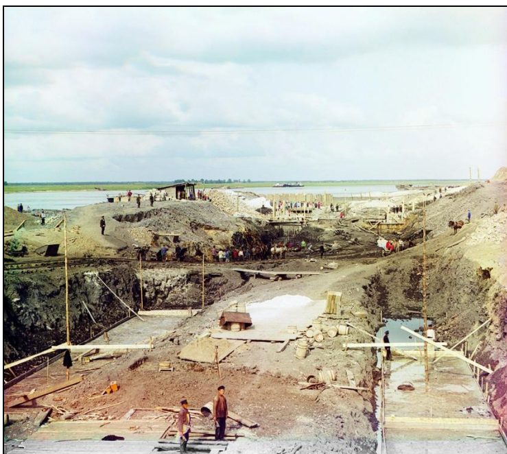
Работа по постройке Кузьминского шлюза. 1912 г.