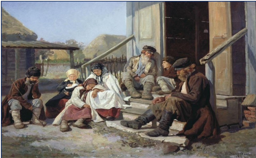
Крестьянская семья на отдыхе. Начало XX века.

5. В начале XX в. Россия- первая в мире по объему сельхозпродукции. На долю России приходилось 50% мирового сбора ржи, 20% пшеницы, 25% экспорта зерна. Несмотря на это С/Х развивалось самотеком. Поля обрабатывались вручную сохой и бороной, не было удобрений, урожайность низкая. В деревне часто голод. Тормозило развитие С/Х сохранение общины и помещичьих хозяйств. На 20 млн. крестьянских хозяйств приходилось 130 тыс. помещичьих. У общины было 4/5 всей крестьянской земли. Также проблемой были «лишние рты» в деревне. Земли всем не хватало, а продуманной переселенческой политикой государство не занималось.