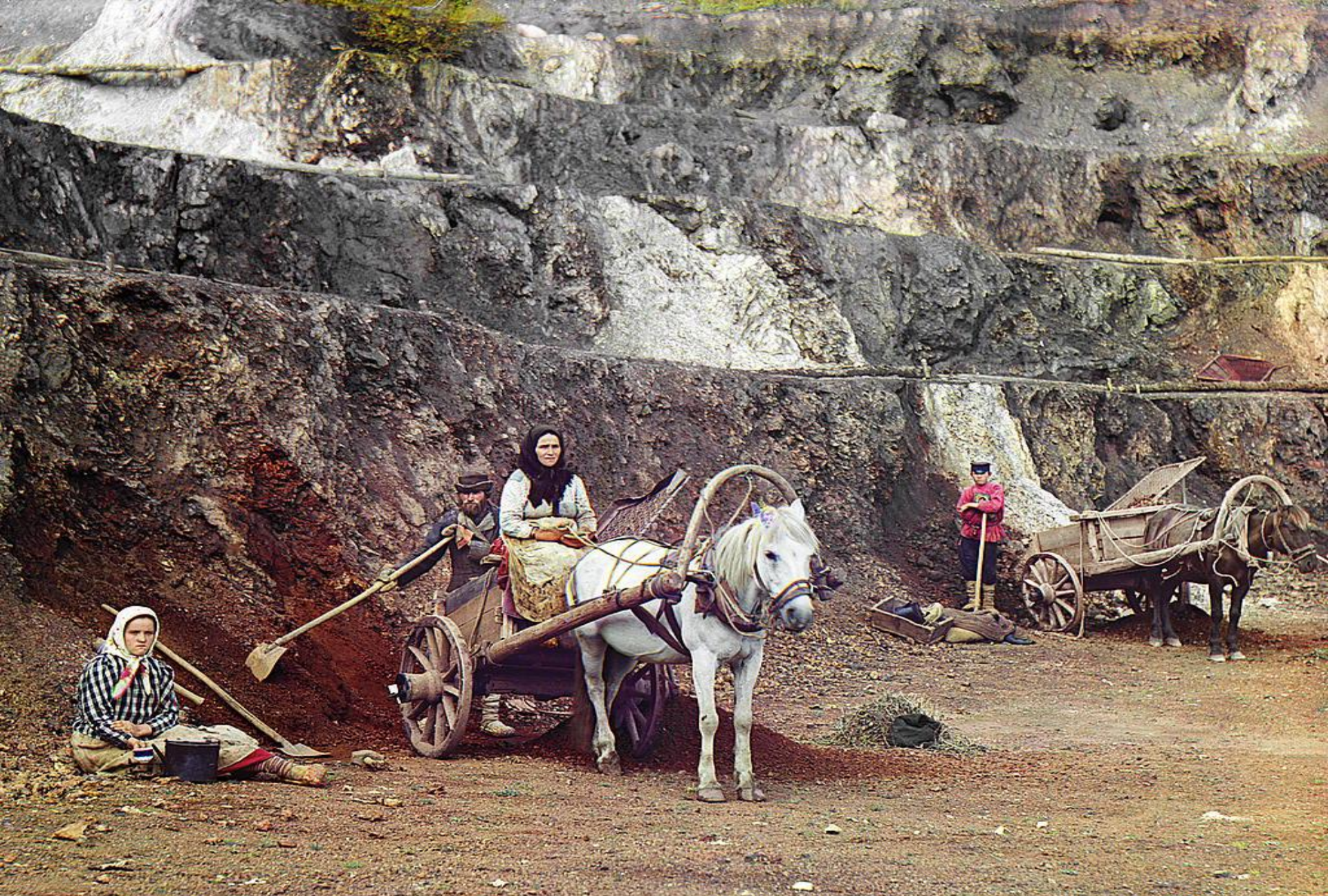
Работа на Бакальском руднике. 1910 г.