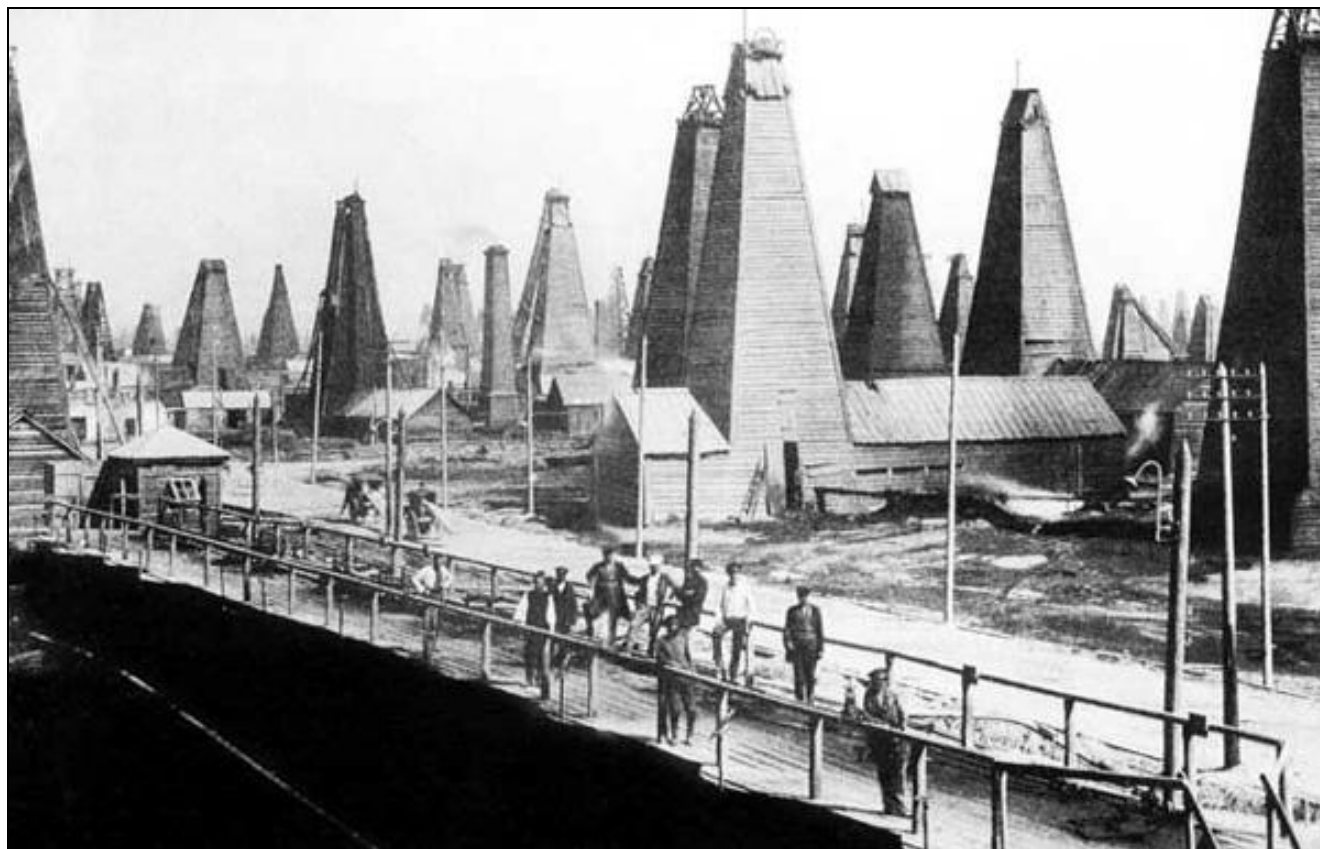
Корпуса монополии «Нобель- Мазут» в Баку.

4. На волне мирового экономического кризиса 1900-1903 гг. в России пострадали предприятия тяжелой промышленности, погибли слабые, малые предприятия, отстающие в финансовом и техническом оснащении. Закрылось свыше 3 тыс. предприятий , на которых работало 112 тыс. рабочих . Ответом капитализма стало создание монополий . Крупнейшими были «ПРОДАМЕТА» (1901), «Продуголь», «Продвагон», «Гвоздь», объединивших под своим началом десятки крупных предприятий.