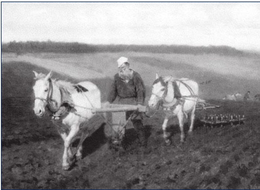
Обработка земли. Начало XX века.