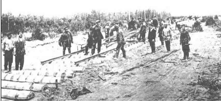
Великий Сибирский путь. — Grand Chemin de la Sibérie. № 45. Укладка пути.