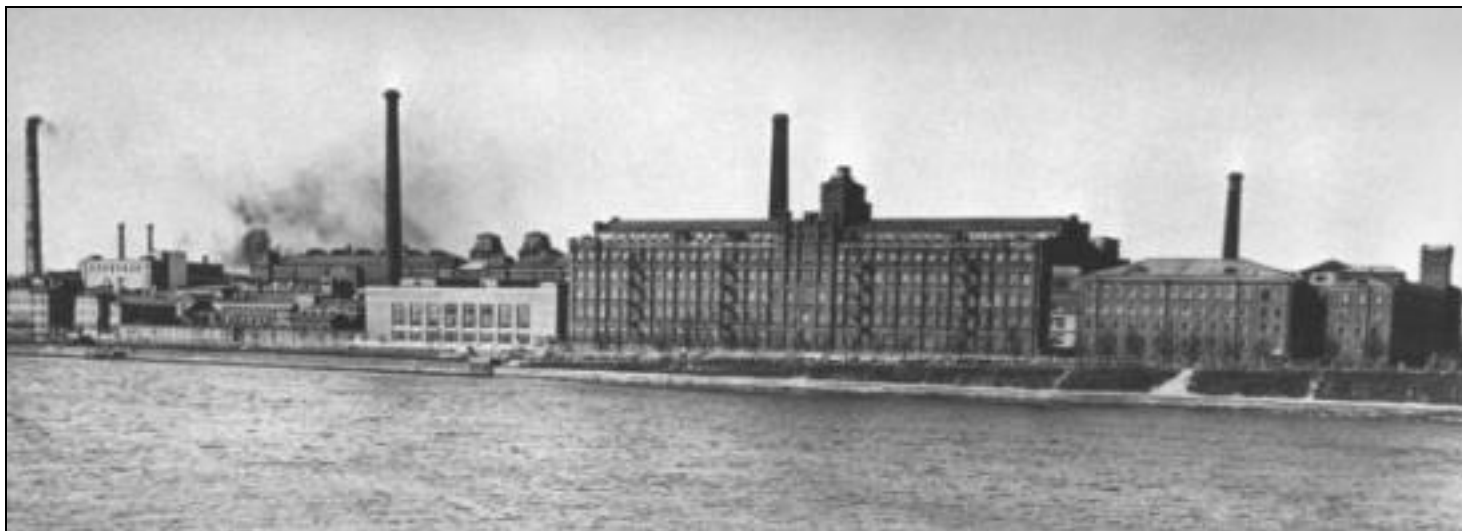
Комплекс построек товарищества Невской бумагопрядильной мануфактуры.