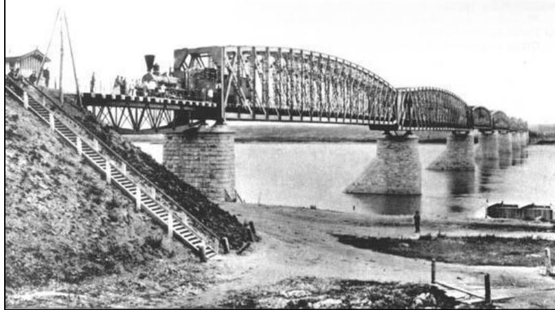
р. Обь, 1897, 820 м