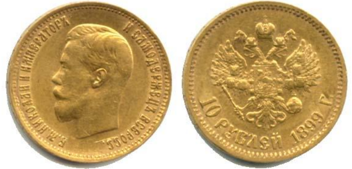
«Николаевский» золотой рубль- имперал.