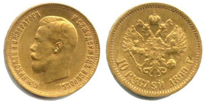
«Николаевский» золотой рубль- имперал.