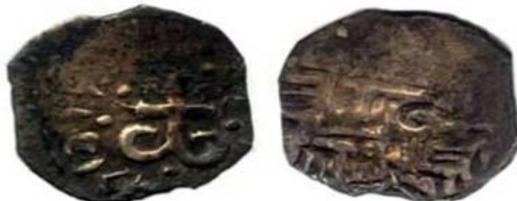
Монета Александра Наримонтовича, Стародуб, 1367-1370 гг. Серебро, диаметр 16 мм, вес 1.45 гр.