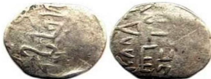
Монета Дмитрия Ольгердовича, Брянск, 1373-1376 гг. Серебро, диаметр 16 мм, вес 1.10 гр.