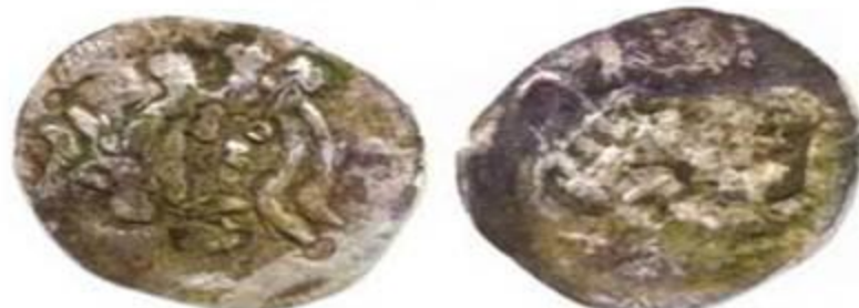
Монета Ягайло Ольгердовича, Вильно, 1387-1388 гг. Серебро, диаметр 14 мм, вес 0.60 гр.