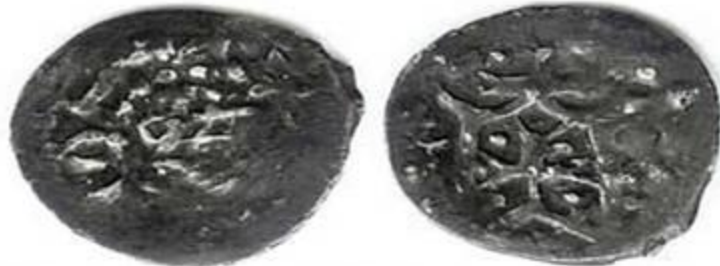
Монета Владимира Ольгердовича, Киев, 1363-1377 гг. Серебро, диаметр 14 мм, вес 0.50 гр.

До этого в качестве денег использовались шкурки пушных зверей, поэтому они часто сохраняли их названия «куны» (куница) и «веверицы» (белки)